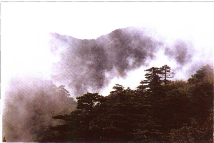
云雾缭绕的苍岚翠峰。