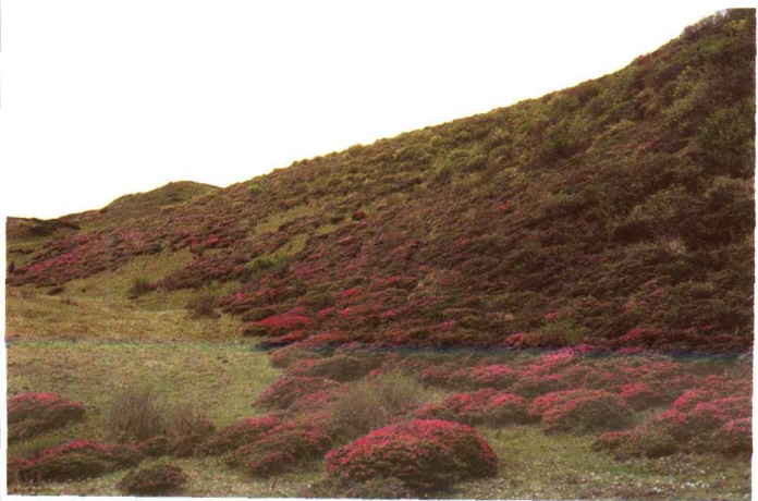
海拔4000米以的伏地 杜鹃丛。