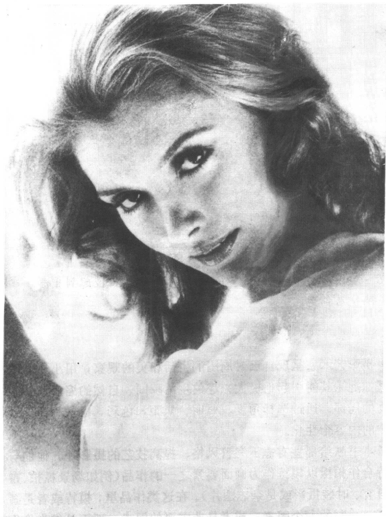
图1 正确选择模特，可使其成为摄影师与欣赏者之间相互交流的中心媒介