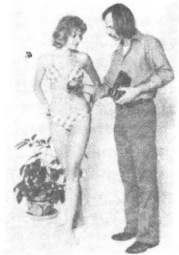
图 2 摄影师和模特之间融洽的关系不仅能使双方享受共度的时光，而且还有助于使作品产生良好的艺术效果

对于摄影师来说，玩笑不能开得过分，这一点也极为重要（也许，从表面上看模特的情绪已被激发起来，但如果她是在极力掩饰自己的窘迫和不快，那将很不利、很被动）。一位摄影师如果偶然偷听到一群模特议论哪位摄影师过于贪婪、哪位摄影师只注重模特的性感，他自己在这方面就要加倍注意。男摄影师同女模特能够做到相互吸引，这无疑会极为有利（特别是通过一种感情暗流相互影响时，其效果更为明显）。这样，模特与相机后面的摄影师交流感情就显得极为自然了。