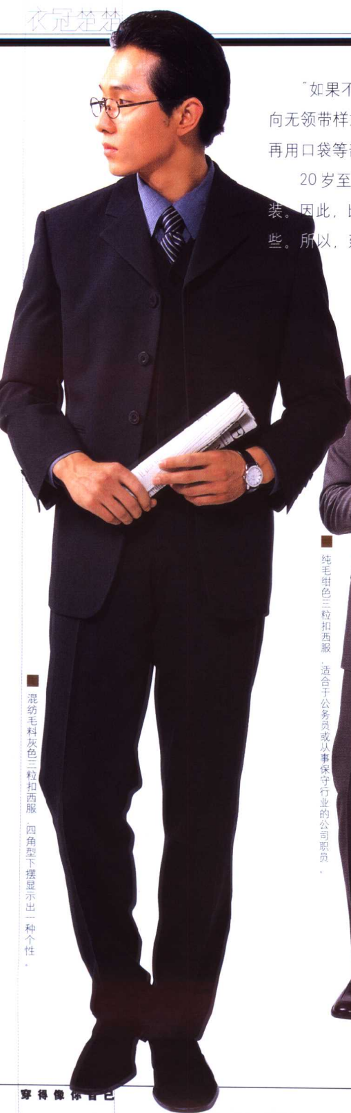
■ 混纺毛料灰色三粒扣西服，四角型下摆显示出一种个性。

“如果不是普通公司职员，而是从事特殊职业的，可大胆地向无领带样式挑战，表现出不拘小节的一面。穿上深灰色西服，再用口袋等部分的独特细节塑造你的个性。