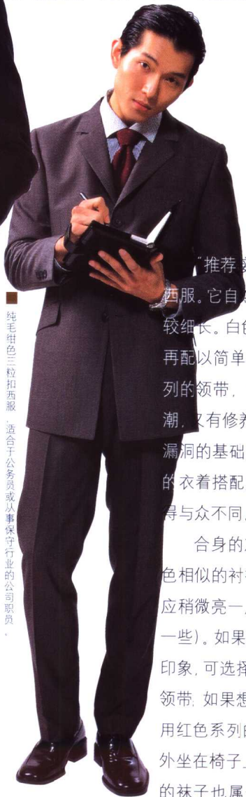
■ 纯毛细色三粒扣西服，适合于公务员或从事保守行业的公司职员。

20岁至30岁男士服装主要趋向于色彩和多样化的性格服装。因此，比起大众化的服装，富有个性的衣着打扮会更好一些。所以，建议试一试有4个至5个纽扣的细长型正装。”