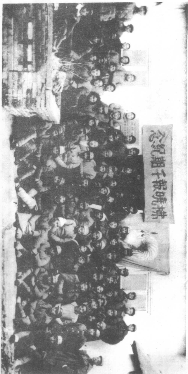
《拂晓报》1000期全社同志合影于安徽泗县城内