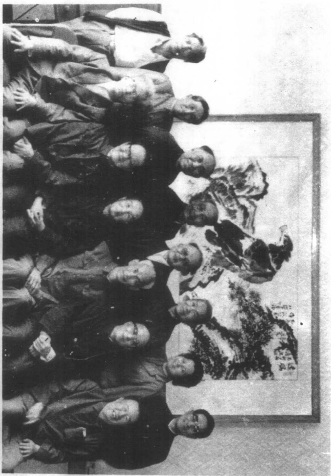
《拂晓报》一部分老同志，1986年在北京聚会，讨论本书初稿时合影