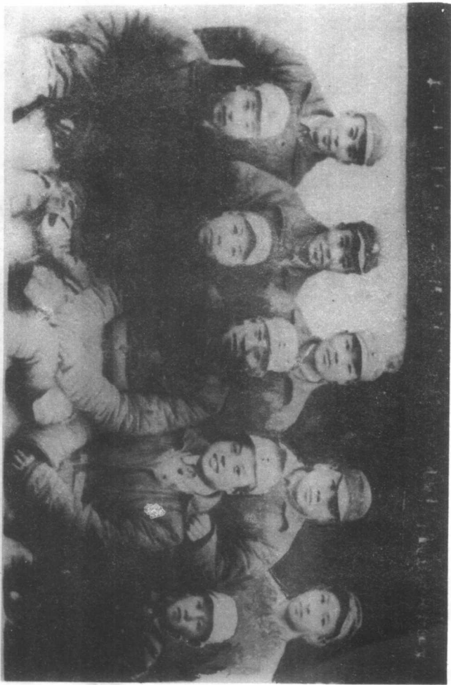
《拂晓报》100期全社同志合影于安徽涡阳新兴集