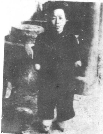
因屡次逃跑，被砍掉手脚的妓女 妓女死后被随便丢进乱尸岗