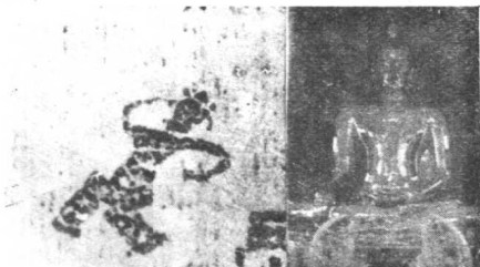
这块砖头的画像如此模糊但也成为妓女的供奉之物