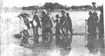
大批难民背井离乡