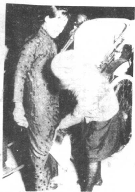
被警察刁难的妓女