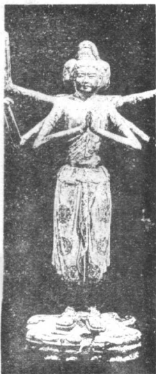
对多首多臂的神像妓女们尤其信奉