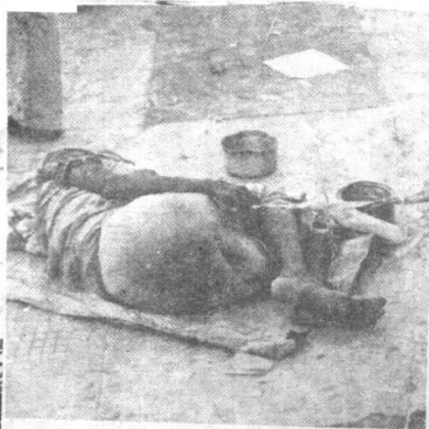
老妓女无家可归，行乞街头的惨景