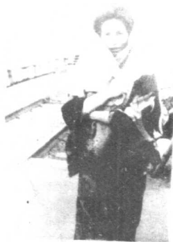
被骗到中国的日本慰安妇