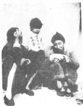
妓女的主要来源之一 就是从难民手中买走她们的女儿