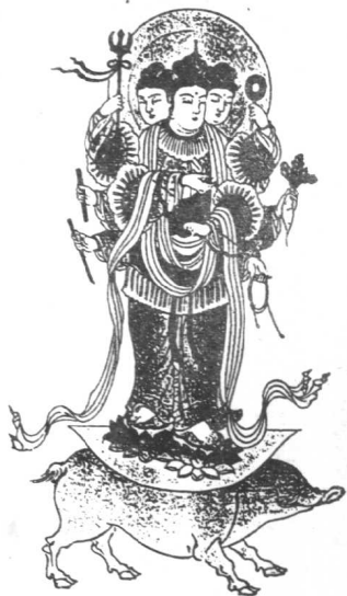
妓女们认为他是插花老主