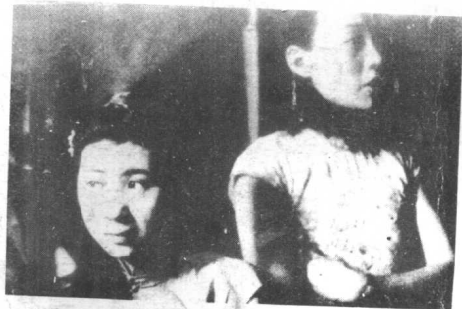
妓女们焦急地倚门待客