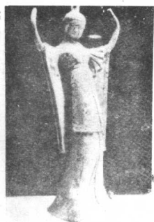
这尊雕像凄惶的表情是否使妓女们联想到自己的命运