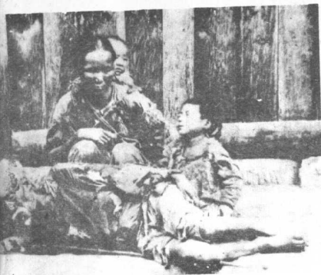
无家可归的难民们