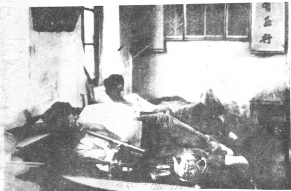
土匪杀掉了父子二人，被抢走的女儿，卖进了新德里妓院