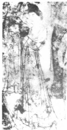
杜十娘成为妓女们供奉的神灵