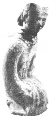
一妓女供奉这张图画，是否它代表了她的愿望