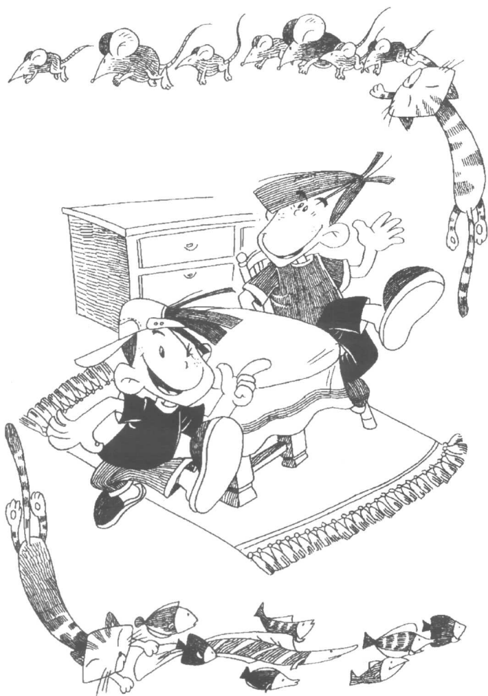
马小跳给爸爸讲故事