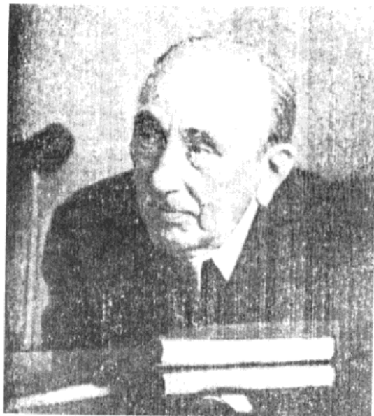
在与杜瓦金谈话时的巴赫金。1973年2月