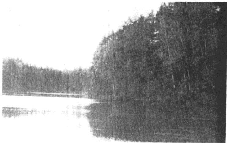
涅维尔近郊的湖泊（现代摄影）