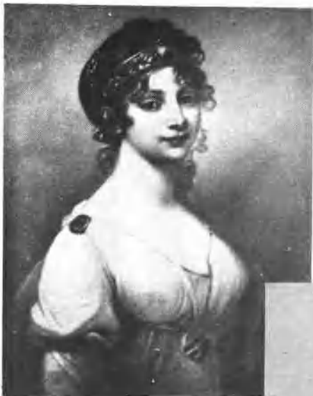
普魯士王后馬利·路易絲