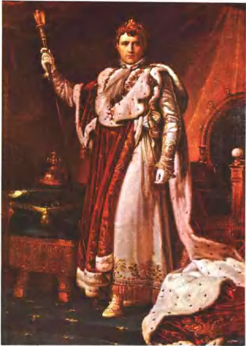
法蘭西人皇帝拿破崙