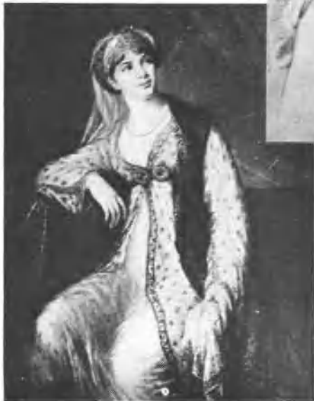
義大利名歌女喬西皮娜·格拉西尼