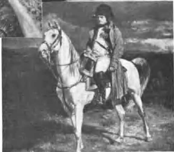
拿破崙於1814年約瑟芬死後