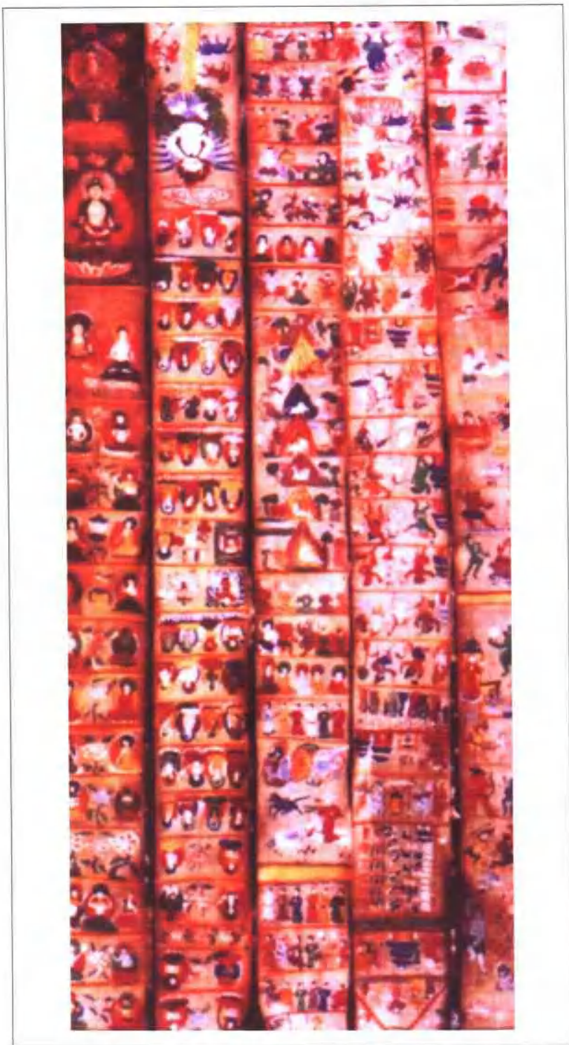
纳西族东巴神路图，上有人、鬼、神共三百七十多个