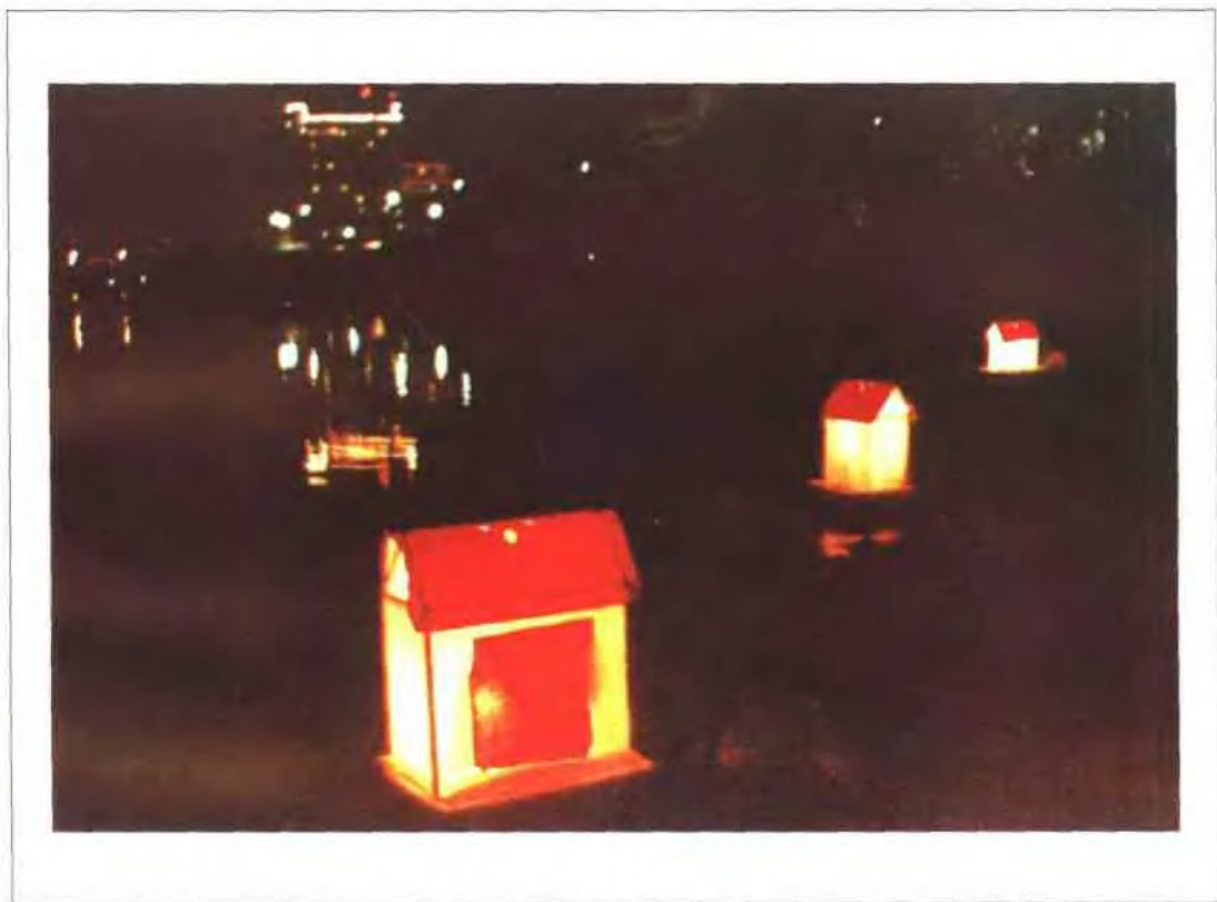
中元节放水灯 旧俗认为这样可以使水鬼脱离苦海