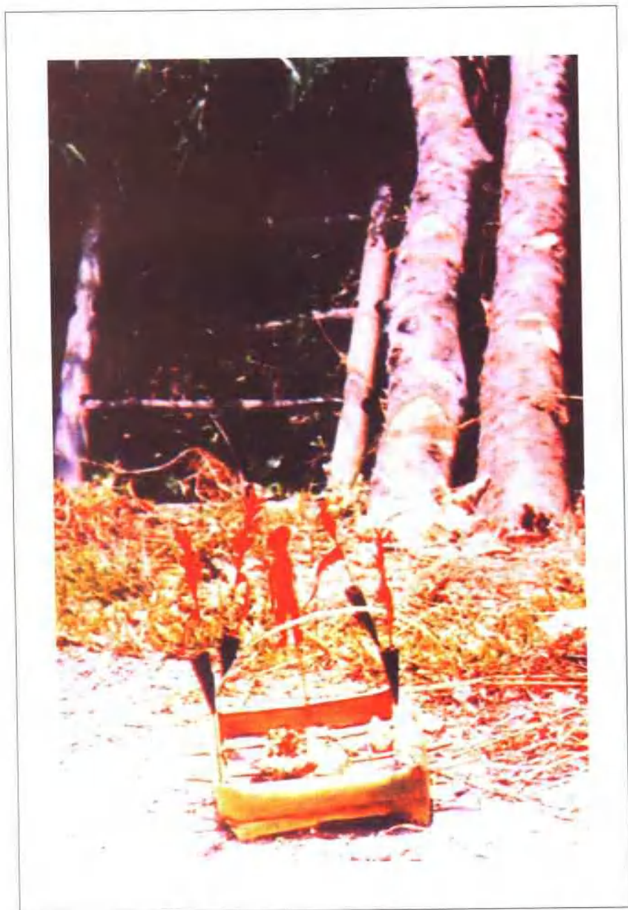
云南沧源佤族为治病招魂用的祭具。在芭蕉杆皮做的小祭坛四角插四杆小纸幡，中间是一个粘在细棍上的人型