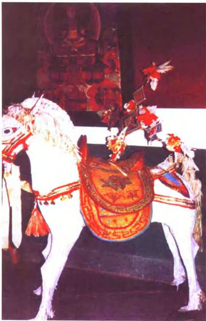
纳西族东巴葬仪中的送魂马