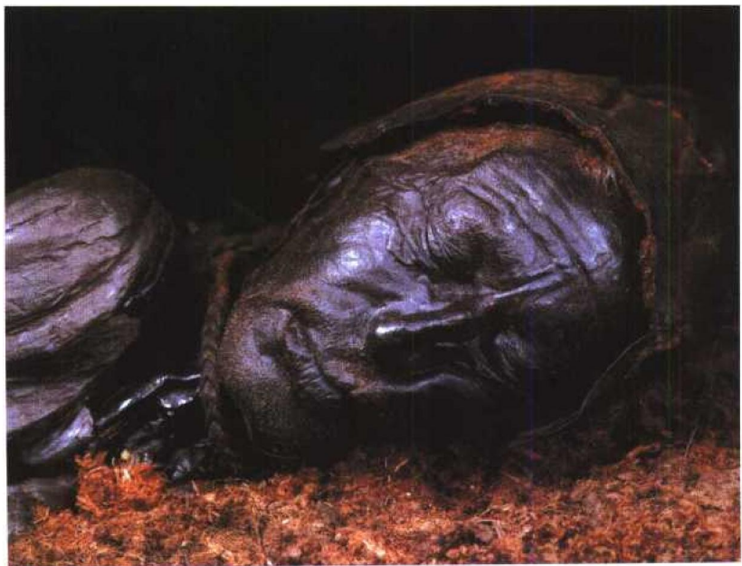
这位托兰德人在泥炭中沉睡了两千年，他已经死了，他的胡须还在顽强地从脸上冒出来。

在自然力量的打击下，人类是渺小羸弱的，孤立无助的。人类死于天灾，就像森林焚于山火，也许这是天意：以大规模速死的方式，来维系生命的更新。