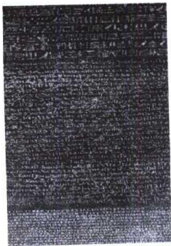
用三种文字镌刻的罗森塔碑