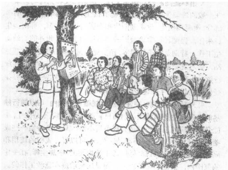
圖 1 利用休息時間進行衛生宣傳

1. 經常領導並廣泛進行衛生宣傳工作,提高羣众的衛生知識水平 要作好衛生宣傳工作,保健員首先要注意培养生產隊里的衛生員或衛生積極分子,領導他們並依靠他們去廣泛深入地開展。在進行衛生宣傳工作的時候,应当利用社員們休息的時間去作,不要影响他們的生產(圖1)。在平時,衛生宣傳工作可以隨時隨地去作,必要時,也可以利用社員大會或社管理委員會去進行。宣傳的方式應該多种多样,內容要生動,这样,才能提高社員們对衛生的認識和兴趣。保健員还