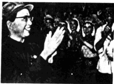
文化大革命期間，江青意氣風發，而趙丹與一些文化人士則紛紛被捕入獄。

舞》、《梁山伯與祝英台》、《黛玉焚稿》、《海之詩》和《醜娃的夢》等一大批優秀舞劇、舞蹈作品。趙青被評為國家一級藝術家，在全國舞蹈家中被評上這種級別的一共只有三人。