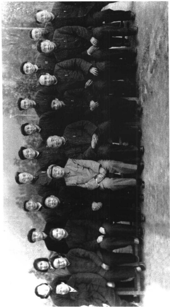
1962年3月12日，朱德委员长到德兴县花桥大茅山垦殖场视察时合影。前排自左至右：陈奇涵夫人、朱旦华、康克清、王卓越、陈奇涵、朱德、周燮衡、曹镜沂、张建、黄庆荣。后排自左至右：朱德女儿、黄秋莲、金永贵、杜润民、刘永孝、朱凤梧、张敏、刘长海、牛奎、张克。