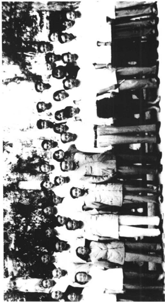
1959年8月18日上午，朱旦华等人在庐山美庐前为毛泽东送行。前排左二至左九依次为：朱旦华、胡德兰、王卓越、黄知真、邵式平、毛泽东、李纳、汪东兴。