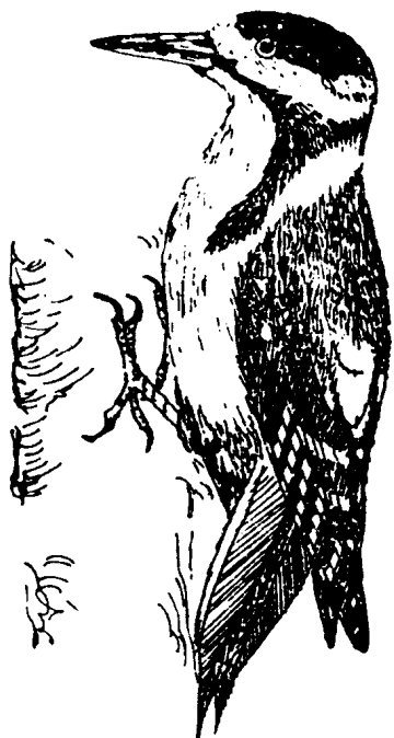
(图4 森林中的啄木鸟)

它的一句话提醒了大家，太子森是在行猎时遇害的，那么凶手一定是身边的人，因为他身边有很多护驾的