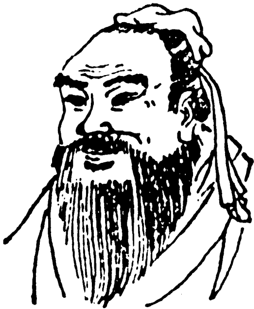
(图2 孔子——公冶长的岳父)

想，一定有一个人和自己长得差不多。果然他进城之后许多人见他都逃走了，而且一个卫士说：“太子殿下，您怎么会在这里？”这一问，把公冶长问得更糊涂了。他于是决定去拜见齐王，问问这到底是怎么回事。可是齐王只说公冶长长得像他的儿子太子森，就又把把打发走了。公冶长这才知道如今世态炎凉，不如回家守着母亲和妻儿过田园生活吧，于是回身又奔往家乡。他正往回走，只见一只喜鹊从高山上滑翔而下，围着他有气无力地盘