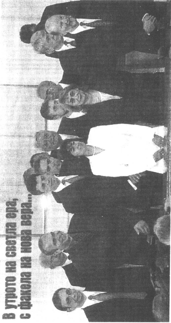
保加利亚新内阁(2001年7月)