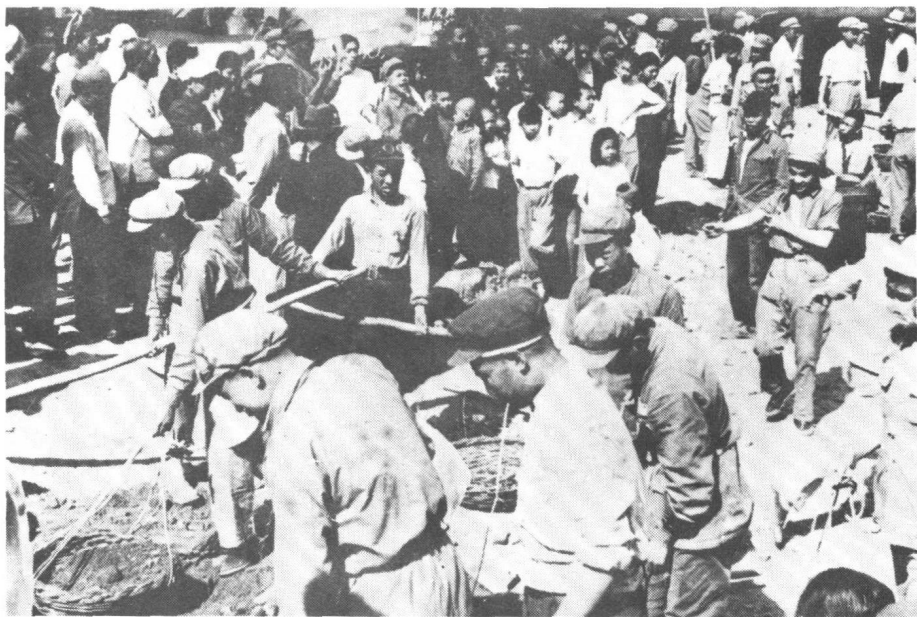
一九三八年春，青训班学员在亮马台开荒，图为劳动后回到指挥部的情况。