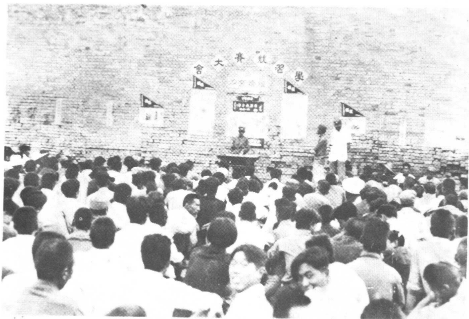
一九三八年，青训班举行学习竞赛大会。