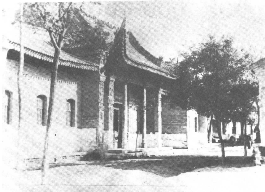
▲陕西省泾阳县安吴堡安吴青训班旧址。