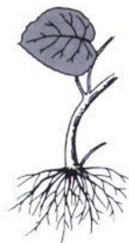
秋海棠属植物的须根

须根 地下主根不明显，是种子萌发时最先发出的根系。自根颈生出大量长短、粗细不一的根系。如四季秋海棠、花叶秋海棠等草本须根系植物；竹节秋海棠等亚灌木状植物，也属须根系。