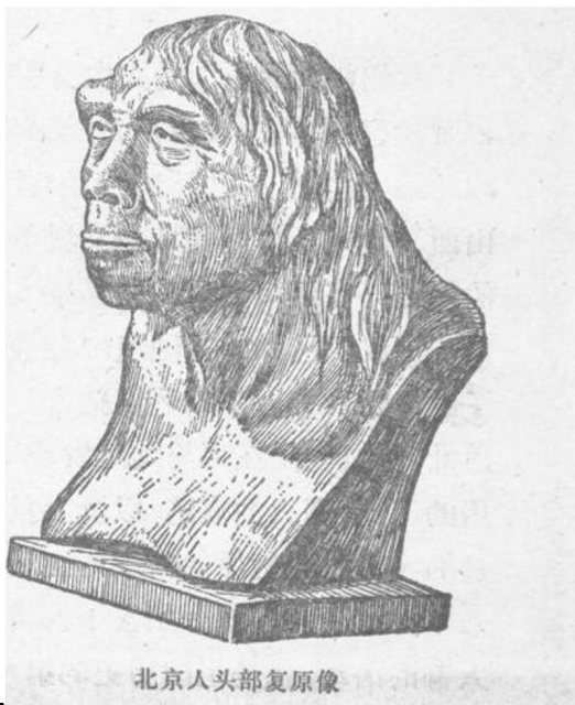
北京人头部复原像

由于用手劳动，下肢担负行走的任务，也得到了发展。用手劳动和直立行走，引起和促进了头脑的变化。北京人体质的发展，证明一个伟大的真理：在从猿到人的转变中，劳动起了决定的作用，“劳动创造了人本身” ① 。