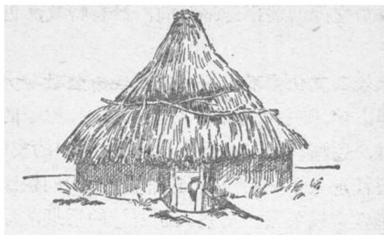
根据半坡遗址复原的圆形房子

的人们使用的工具有骨器、木器、石器和陶器。在骨器中有大量的骨耜(sì)。他们用骨耜翻地，种植水稻。水稻的种植，扩大了食物来源。我国是世界上最早栽培水稻的国家之一，对人类作出了贡献。河姆渡氏族的人们还饲养猪、狗和水牛。他们建筑木结构的房屋，过着定居的生活。