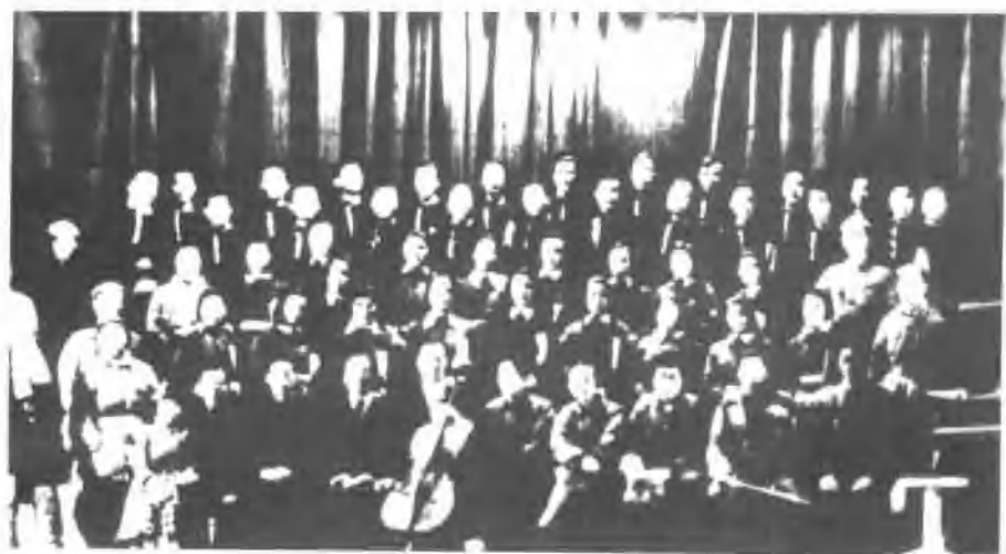
1942年1月12日，延安鲁艺合唱团首演吕骥作曲的《凤凰涅槃》。