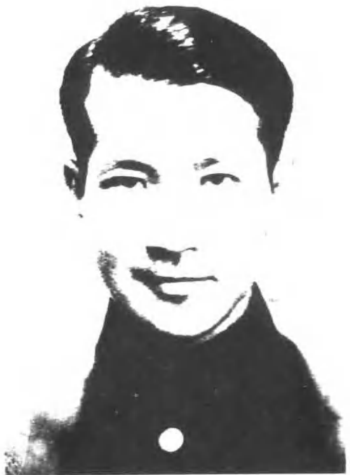
人民音乐家冼星海