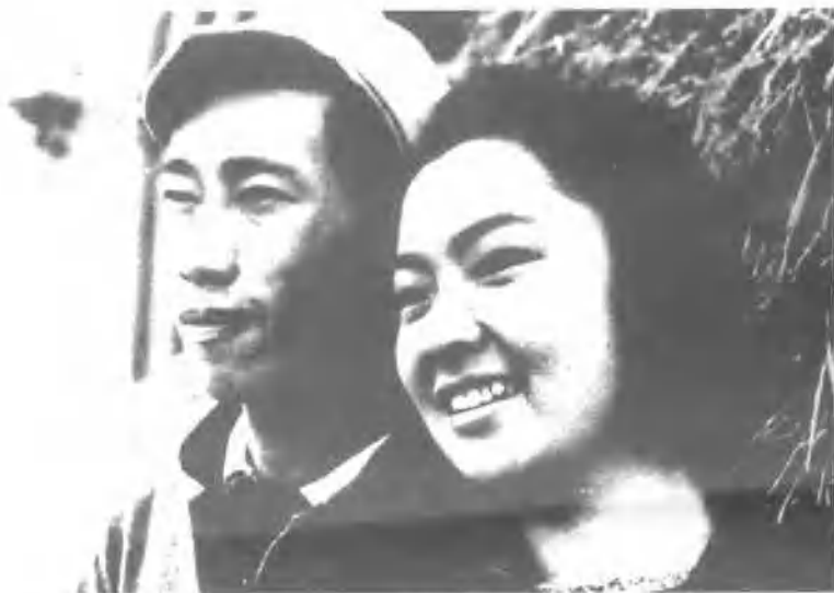
1945年，李焕之与李群在延安鲁艺。