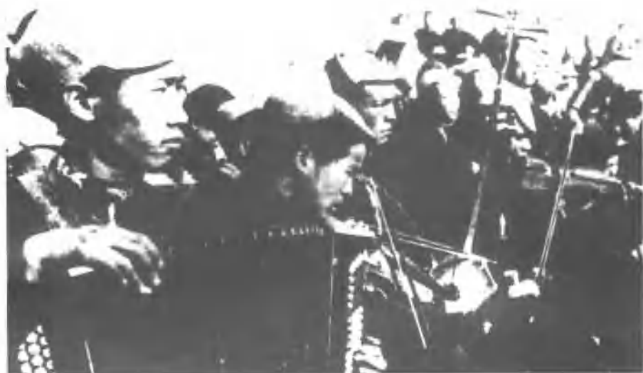
李焕之在延安街头为群众演出（左一）。