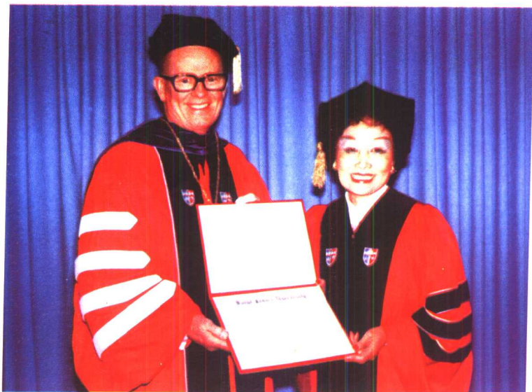
陈香梅在美国纽约圣约翰大学接受名誉博士学位。