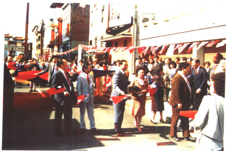
在纽约中国城为共和党杜尔助选。