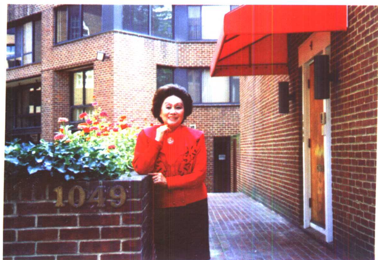
1995年在华府自己的办公楼前。