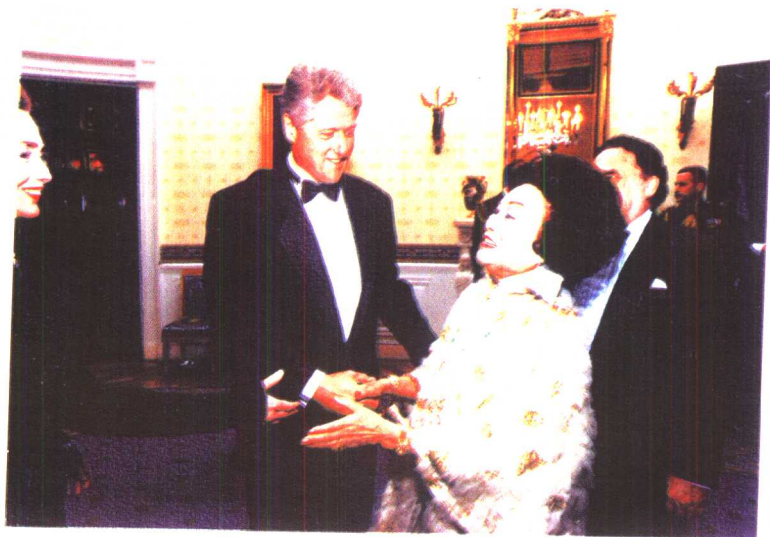
1996年4月30日出席克林顿总统在白宫的晚宴。