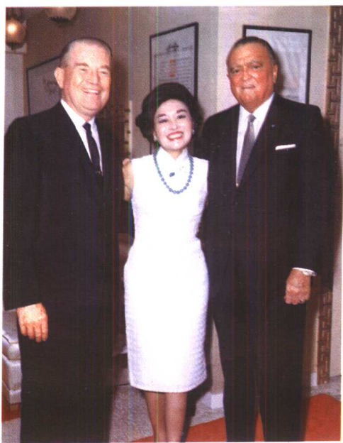
陈香梅与胡佛（美国联邦调查局局长）、罗宾（美国情报局局长），摄于公寓所招待酒会。