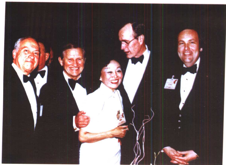
陈香梅和美国总统布什在一起。