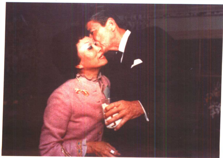
里根总统和陈香梅亲密的一吻。