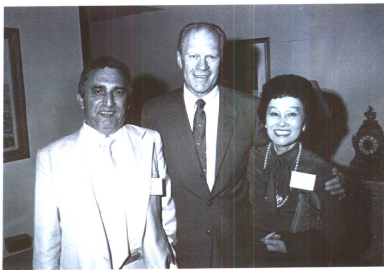
前美国总统福特和陈香梅、郝福满在白宫见面。