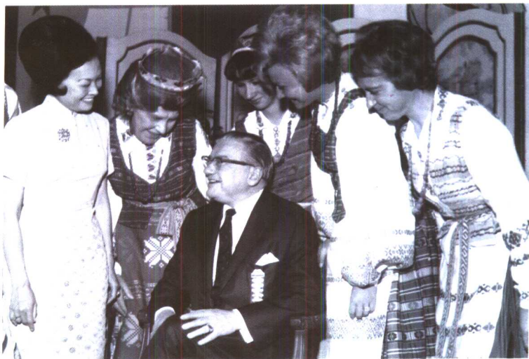
1976年陈香梅和美国少数民族一起助选。