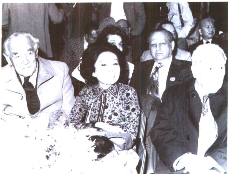
1976年陈香梅在纽约共和党竞选总部。