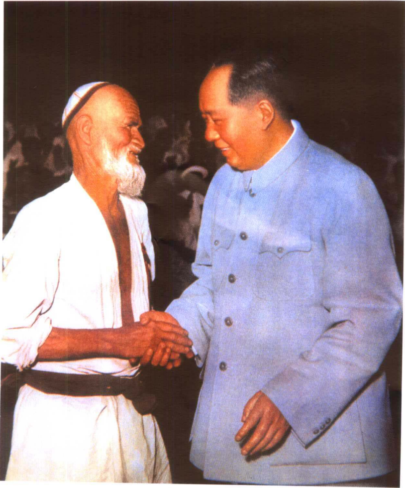
毛泽东亲切接见新疆维吾尔族农民库尔班·吐鲁木