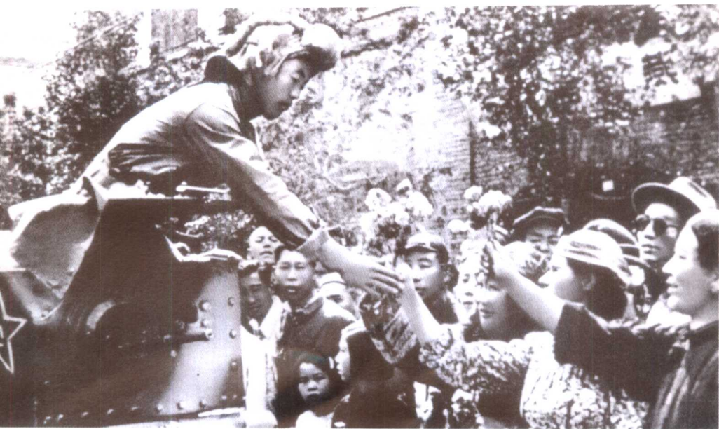
1949年9月，新疆和平解放。人民解放军受到各族人民欢迎