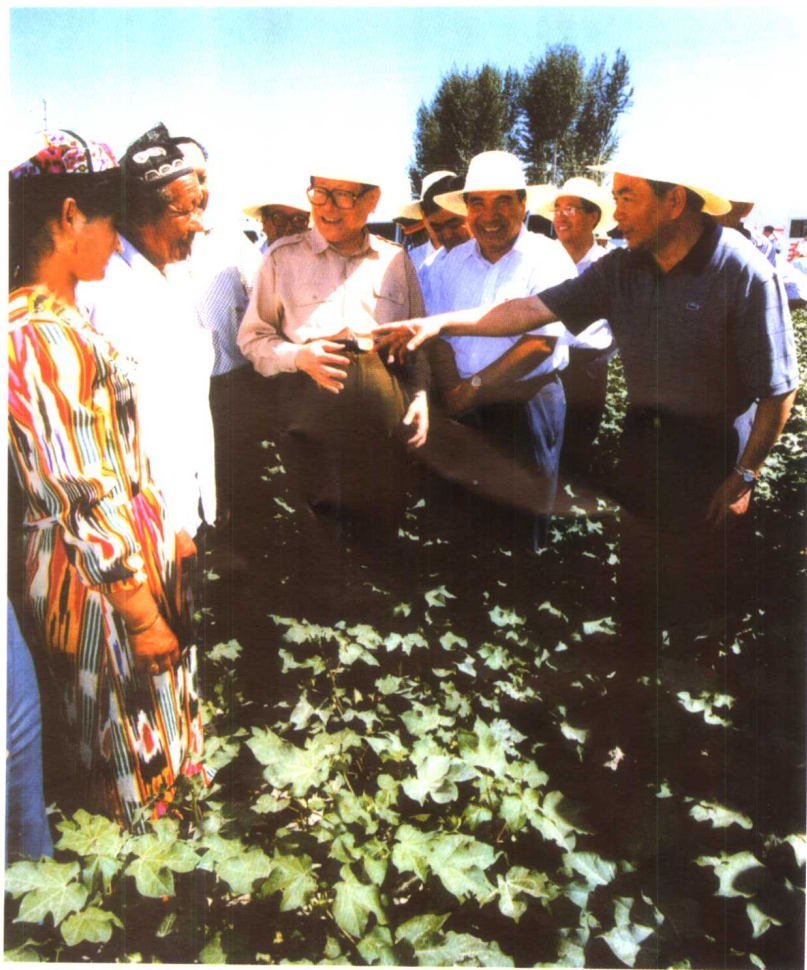
江泽民在新疆视察