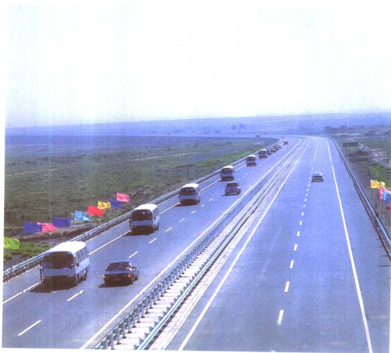
吐鲁番——乌鲁木齐——大黄山高等级公路