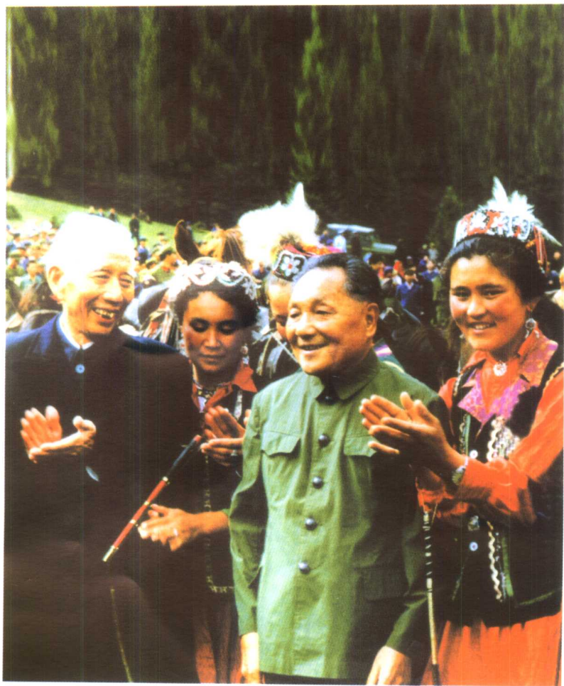
邓小平与新疆哈萨克族牧民在一起