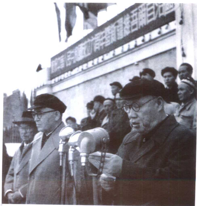
1955年10月1日，新疆维吾尔自治区成立，董必武宣读党中央贺信