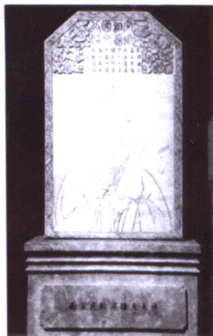
北京文丞相祠堂像碑