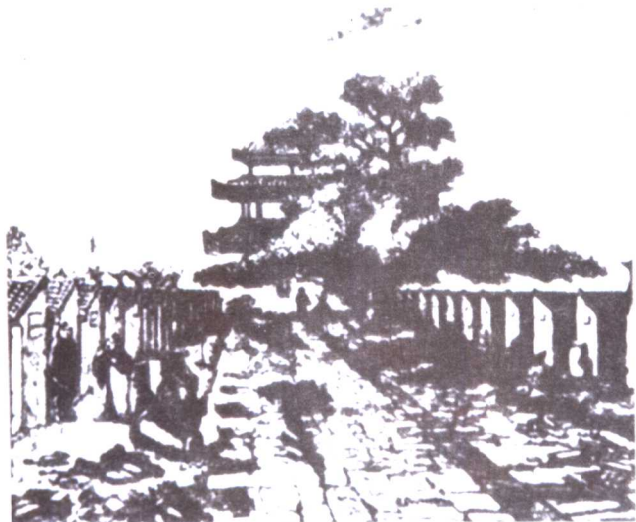
清代科举考场——北京贡院