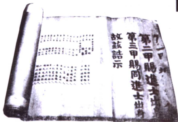
张贴于皇宫官门的大金榜