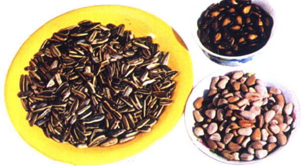
炒葵花子、椒盐瓜子、炒松子