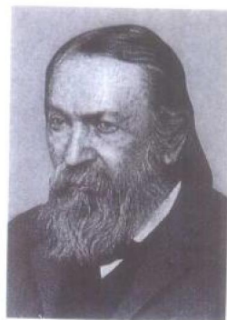
E. 马赫 奥地利物理学家、心理学家兼科学哲学家。

经济的方法摘录下来,因为这些记载可以让我们在遇到不同情况时,很快的就想起以前所遇到的一些经验。任何物理的学说,与物体有关,若不能化简为一般可知觉的经验,则不能称为学说,只能说是玄学。例如,研究科学应该摒弃绝对空间和绝对时间的观念。因为空间并非单独存在的东西,其性质要视内部的物质,分布情况而定。另一种说明其观念的方法是马赫原理,他体认到一个物体的运动,只有在相对于宇宙中其他物体时来描述才是有意义的,而不是以绝对空间的观念来描述。另外,一个过程运作的时间,只能与时钟上时针、分针运转了多少来比较,而绝非以绝对时间前进多少来比较。马赫在这一方面的教旨,对于爱因斯坦及起源于维也纳马赫创设之知识领域的欧洲逻辑实证主义,有相当大的影响。