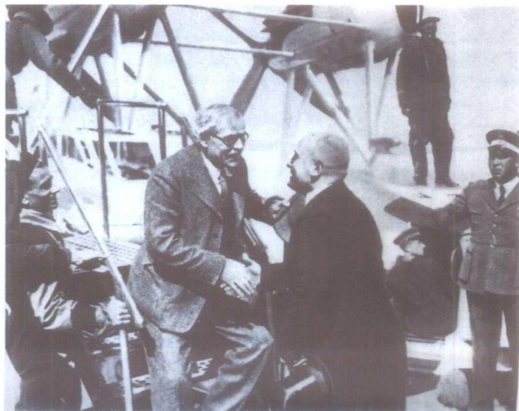
R. 麦克唐纳 英国首相，英国工党的创立者之一，也是第一位工党首相。图为1933年3月麦克唐纳访问罗马时，墨索里尼亲赴机场欢迎。

麦克唐纳曾出版数本书，包括《南非见闻》(What I Saw in South Africa, 1905)、《社会主义及政府》(Socialism and Government, 1909)、《印度政府》(The Government of India, 1919)、《国会与民主》(Parliament and Democracy, 1919)、《社会主义：批评与建设》(Socialism: Critical and Constructive, 1924)