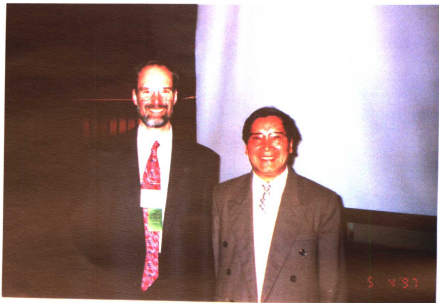
1997年5月与加拿大维多利亚大学校长合影