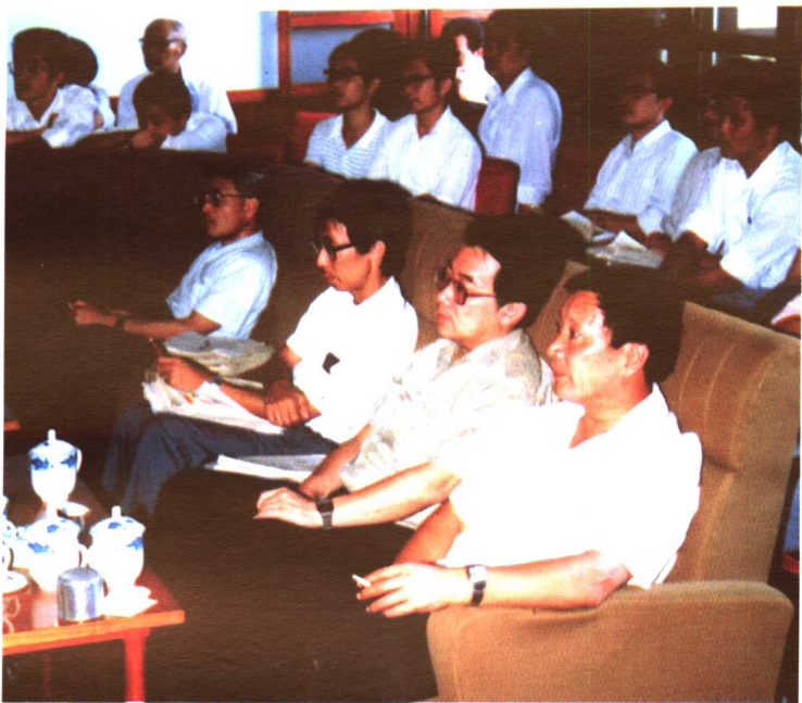
大利亚、香港等专家教授一起讨论学术报告 在全国方言学会年会上与美国、法国、日本、澳