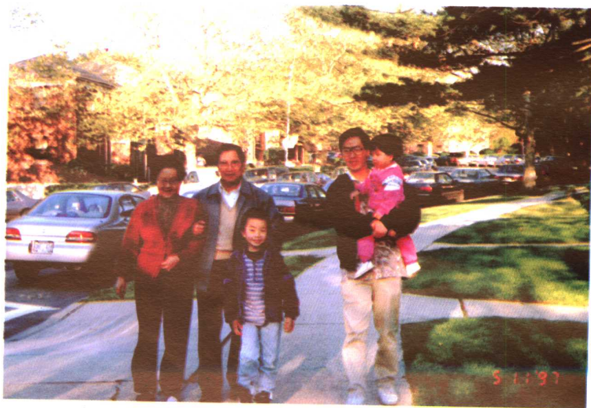
1997年6月在美国纽约与儿孙们在一起