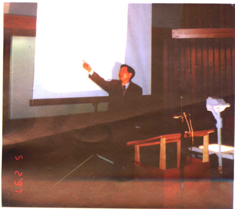
一九九七年五月在加拿大北美洲汉语言学国际 研讨会上作学术报告