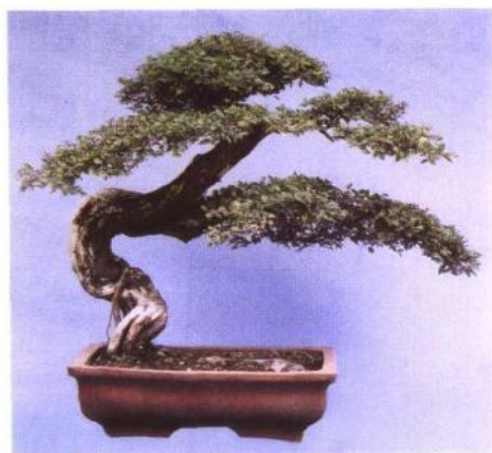
▼ 这是其他流派的盆景。