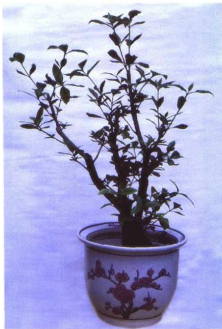
▲这是水养的水横枝。

岭南盆景的前辈们在买卖树桩、盆景栽培修剪技艺交流中，创造了顺应自然和适应岭南气候的“截干蓄枝”手法。以孔泰初为代表的岭南盆景一代宗师，在40年代创造了大树型的形格，培养出的盆景形似自然界的苍老古树，在盆景界引起很大的反响。岭南盆景的另一位宗师素仁和尚，则汲取岭南画派的技法，创作出飘逸型的风格。