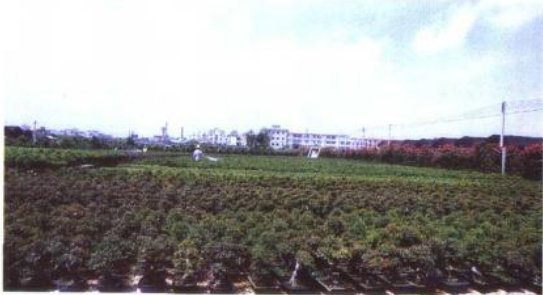
▲出口盆景生产基地一角。

其一，盆景的生产向产业化发展。目前，岭南盆景已经一改以往在阳台天棚栽培的方式，正在向产业化、市场化生产的方向发展，广州市的芳村区、番禺区、花都区成为了岭南盆景的主产区，位于广州市芳村区的广州花卉博览园和顺德陈村花卉世界成为广东盆景的两大交易市场，产品不仅畅销国内，而且远销东南亚、西欧和北美各国。