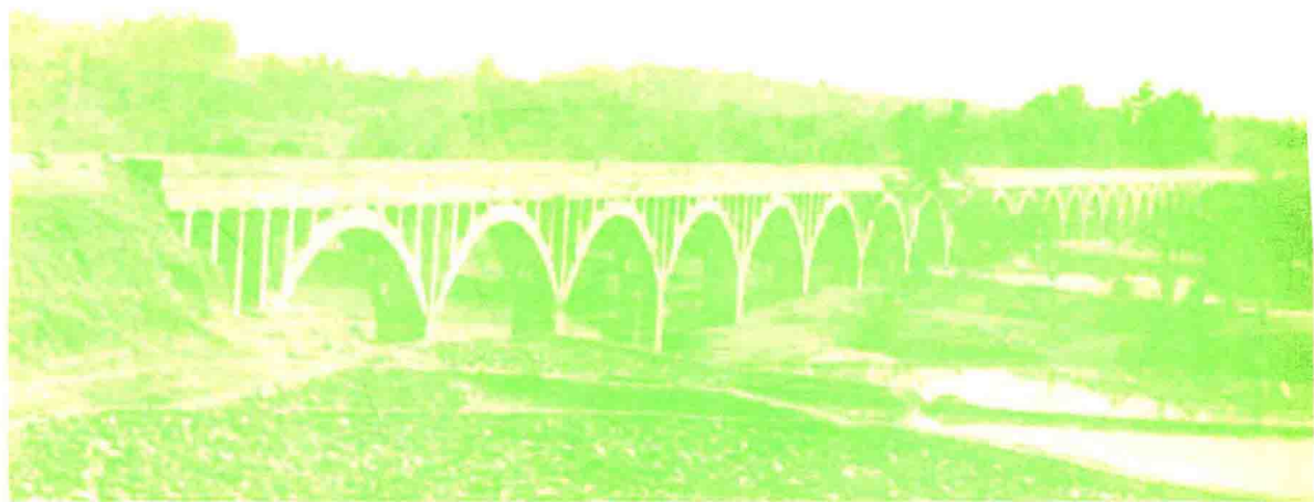
“凉亭渡槽”：位于莲花公社凉亭大队，是孝溪水库的配套工程，为31跨石拱渡槽，全长600米，是全县最长的石拱渡槽。