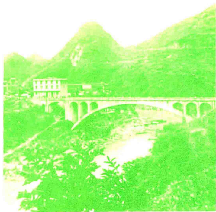
石堤大桥：我县境内公路桥梁已全部建成石拱桥。因为秀山—石堤公路，在石堤街头跨越梅江河的大型石拱桥，一九七六年五月建成，全长118米，宽6米，主拱跨径70米，为境内目前单拱跨径最大的公路桥。