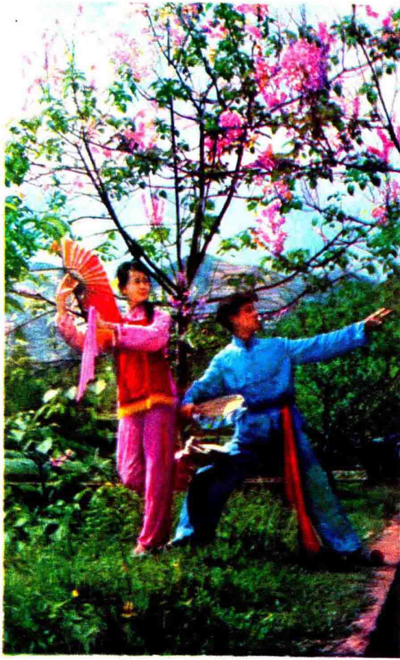
「秀山花灯」：动作轻快，舞姿优美。反映了秀山土家族苗族人民独特的乡风民俗，是秀山民间文艺的一朵瑰丽鲜花。