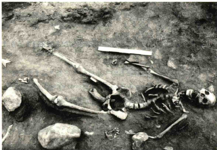
阴部被插入牛角的受害女性