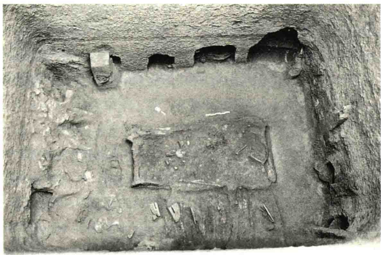
极尽考究的陶寺大墓，墓室与壁龛内遍布各类随葬品

在可以想见的排场的安葬仪式上，人们把一具船形木棺安放在深深的墓室底部正中。木棺由一根整木挖凿而成，通体红彩鲜艳夺