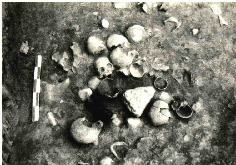
被砍切下的人头骨