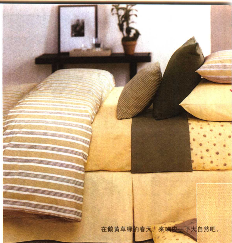
在鹅黄草绿的春天，来响应一下大自然吧。