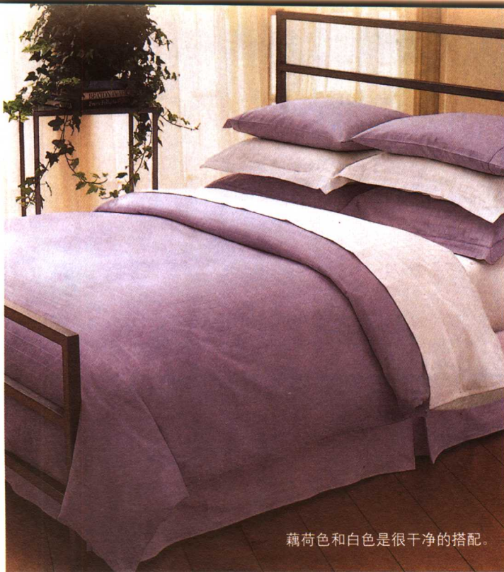
藕荷色和白色是很干净的搭配。