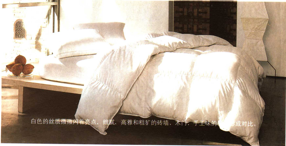
白色的丝质微微闪着亮点，细腻、高雅和粗犷的砖墙、木门、手工味的地毯形成对比。