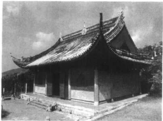
图 1.1 杨湾庙正殿

此殿建造年代，根据上述各点，并参考光绪苏州府志、民国吴县志、太湖备考等书，碧霞元君祠碑记，建筑物梁枋上的记年，说明它创自元末，复经明、清两代重修，尤以清初顺治十二年席本楨那一次修建最大，也就是