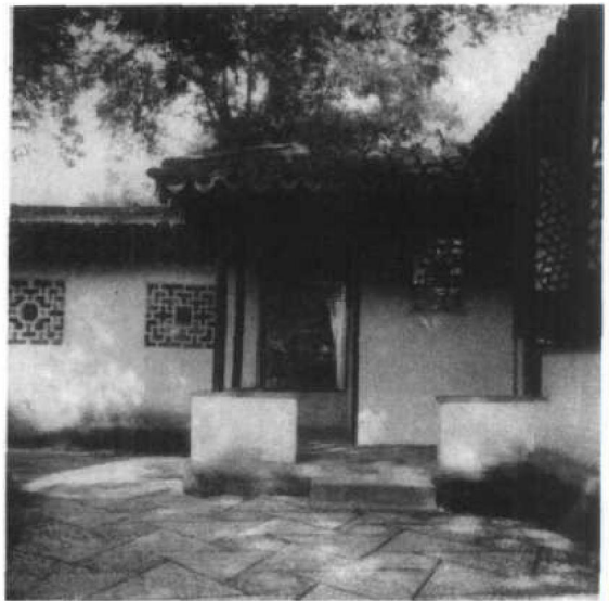
图 1.2.5 海棠春坞入口

岛平面为三角形，与雪香云蔚亭一岛椭圆形者有别，两者之间一溪相隔，溪上覆以小桥，其旁幽篁丛出，老树斜依，而清流涓涓，宛若与树上流莺相酬答，至此顿忘尘嚣。自雪香云蔚亭而下，便到荷风四面亭。亭亦六角，居三路之交点，前后皆以曲桥相贯，前通倚玉轩而后达见山楼及别有洞天。经曲廊名柳荫路曲者达见山楼，楼为重檐歇山顶，以假山构成云梯，可导至楼层（图 1.2.3）。是楼位居中部西北之角，因此登楼远望，其至四周距离较大，所见景物亦远，如转眼北眺，则城隈景物，又瞬入眼帘了。此种手法，在中国园林中最为常用，如中由吉巷半园用五边形亭，狮子林用扇面亭，皆置于角间略高的山巅。至于此园面积较大，而积水弥漫，建一重楼，但望去不觉高耸凌云，而水间倒影清澈，尤增园林景色（图 1.2.4）。然在设计时，应注意其立面线脚，宜多用横线，盖与水面取得平行，以求统一。香洲俗呼“旱船”，形似船而不能行水者。入舱置一大镜，故从倚玉轩西望，镜中景物，真幻莫辨。楼上名邀观楼，亦宜眺远。向南为得真亭，内置一镜，命意与前同。是区水面狭长，上跨石桥名小飞虹，将水面划分为二。其南水谢三间，名小沧浪，亦跨水上，又将水面再度划分。两者之下皆空，不但不觉其局促，反觉面积扩大，空灵异常，层次渐多。人们视线从小沧浪穿小飞虹及一庭秋月啸松风亭，水面极为辽阔，而荷风四面亭倒影、香洲侧影、远山楼角皆先后入眼中，真有从小窥大，顿觉开朗的样子。枇杷园在远香堂东南，以云墙相隔。通月门，则嘉实亭与玲珑馆分列于前，复自月门回望雪香云蔚亭，如在环中，此为最好的对景。我们坐园中，垣外高槐亭台，移置身前，为极好的借景。园内用鹅卵石铺地，雅洁异常，惜沿墙假山修时变更原形，而云墙上部无收头，转折又略嫌生硬。从玲珑馆旁曲廊至海棠春坞（图 1.2.5），屋仅面阔两间，阶前