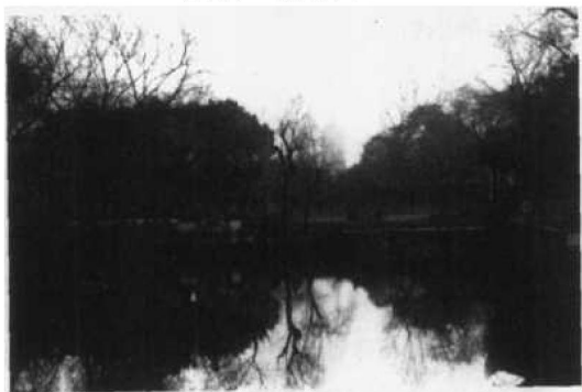
图 1.2.2 远借北寺塔