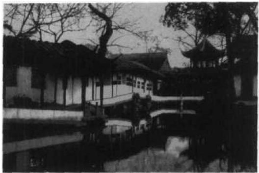
图 1.2.6 拙政园西部游廊

宛若凌波。是苏州诸园中之游廊极则(图 1.2.6)。卅六鸳鸯馆与十八曼陀罗花馆系鸳鸯厅,为西部主要建筑物,外观为歇山顶,面阔三间,内用卷棚四卷,四隅各加暖阁,其形制为国内孤例。此厅体积似乎较大,其因实由于西部划分后,欲成为独立的单位,此厅遂为主要建筑部分,在需要上不能不建造。但碍于地形,于是将前部空间缩小,后部挑出水中,这虽然解决了地位安顿问题,但卒使水面变狭与对岸之山距离太近,陆地缩小,而本身又觉与全园不称,当然是美中不足处。此厅为主人宴会与顾曲之处,因此在房屋结构上,除运用卷棚顶以增加演奏效果外,其四隅之暖阁,既解决进出时风击问题,复可利用为宴会时仆从听候之处,演奏时暂作后台之用,设想上是相当周到。内部的装修精致,与留听阁同为苏州少见的。至于初春十八曼陀罗花馆看宝朱山茶花夏日卅六鸳鸯馆看鸳鸯于荷菡间,宜乎南北各置一厅。对岸为浮翠阁,八角两层,登阁可鸟瞰全园,惜太高峻,与环境不称。其下隔溪小山上置两亭,即笠亭与扇面亭。亭皆不大,盖山较低小,不得不使然。扇亭位于临流转角,因地而设,宜于闲眺,故颜其额为“与谁同坐轩”。亭下为修长流水,水廊缘边以达倒影楼。楼为歇山顶,高两层,与六角攒尖的宜两亭遥遥相对,皆倒影水中,互为对景。鸳鸯厅西部之溪流中,置塔影亭,与其北的留听阁,同样在狭长的水面两端尽头,而外观形式亦相仿佛,不过地位视前两者为低,布局与命意还是相同的。塔影亭南,原为补园入口以通张宅的,今已封闭。