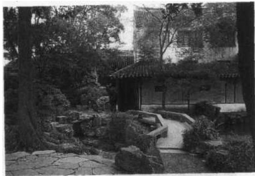
图 1.2.1 拙政园原入口