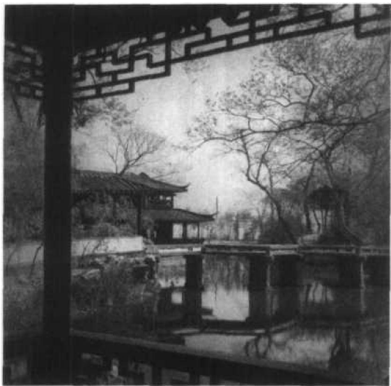
图 1.2.4 拙政园自别有洞天望见山楼及五曲桥