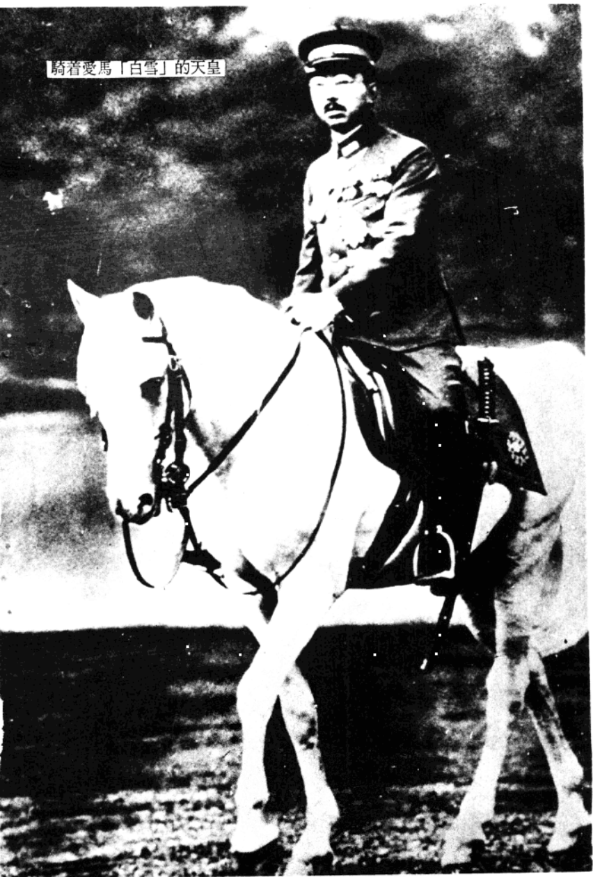
騎着愛馬「白雪」的天皇