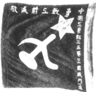
红二十五军三团一连旗帜。