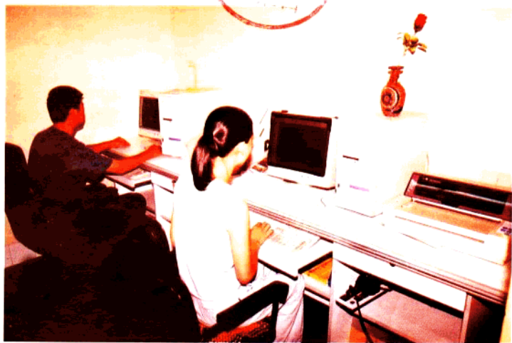
微机室中的嘉庆子