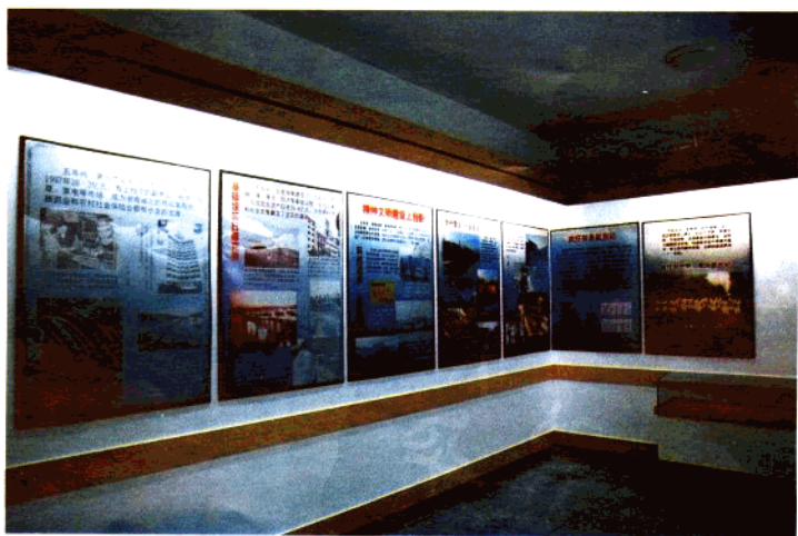
图 1-1-1 博物馆展陈设计