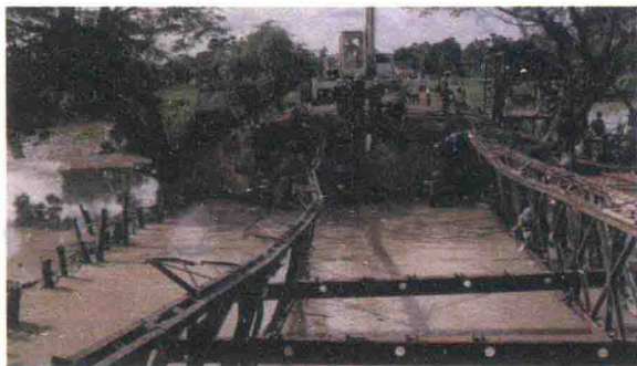
清理被炸毁的桥梁