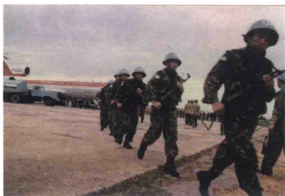
中国赴柬埔寨维和工程兵大队抵达维和任务区

古老的长城脚下悄然驶出，满载着对和平的渴望踏上征程。这就是中国第一支参加联合国维和行动的部队——中国人民解放军赴柬埔寨维和工程兵大队。中国军队与