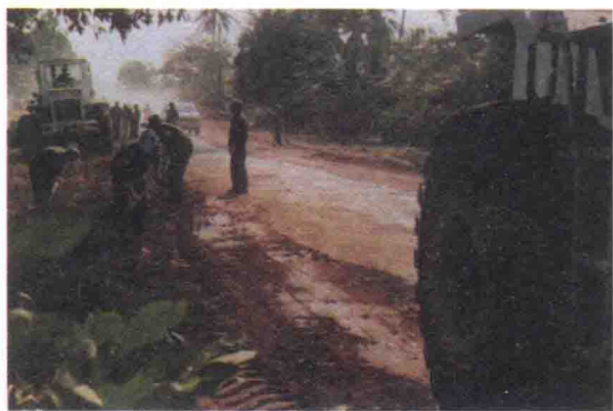
中国工兵在热带雨林中抢修道路

波成东机场位于金边市以西约7公里处，是柬埔寨的国际机场，也是金边政府军的空军机场。随着数万名联合国维和人员陆续到来，运送人员、物资装备及国际救援物资使波成东机