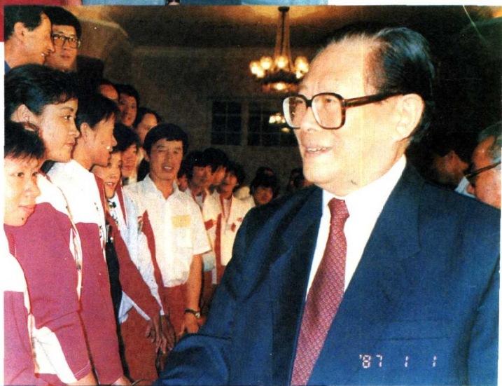
江泽民同志接见马家军。