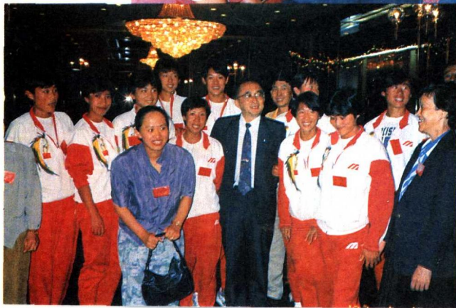
的姑娘们。 国家体委主任和马家军