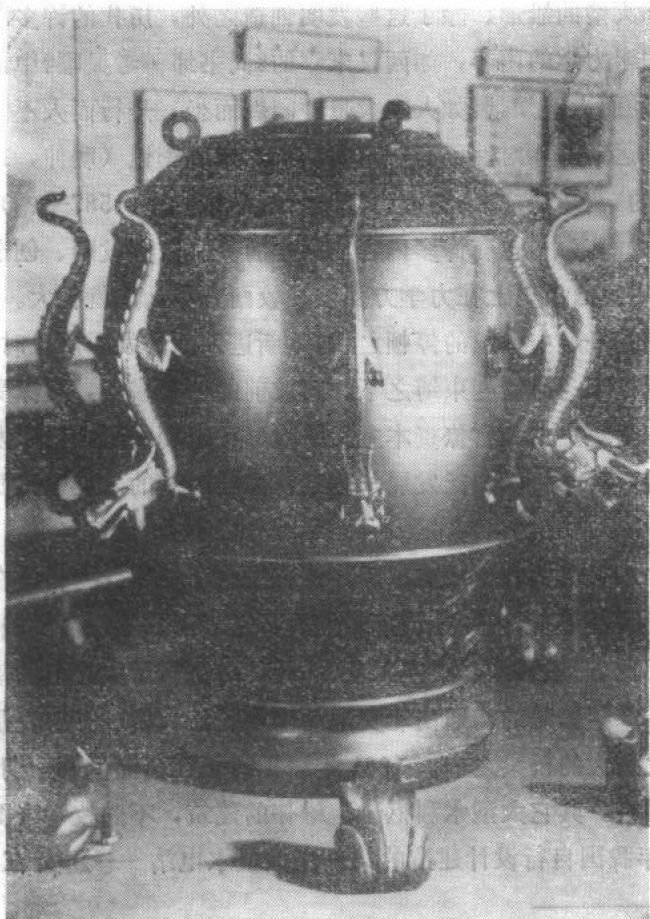
图二 地动仪复原模型

修建这些工程时,都必须解决材料运输、建筑物的稳定等与力学有关的问题。西汉(公元前 206—公元 23)时期的文献所记载的指南车和记道车(自动记里程的车),都使用了复杂的齿轮传动系统。东汉(公元 25—220)张衡(78—139)制造的“地动仪”(图二)是世界上第一台测震的仪器,“形似酒樽……。中有都柱,……外有八龙,首衔铜丸。下有蟾蜍,张口承之,……如有地动,樽则振,龙机发吐