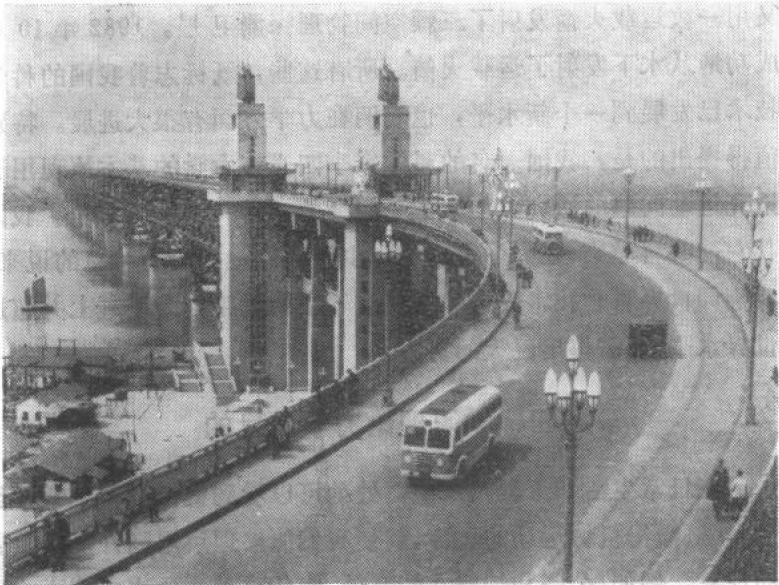
图三 南京长江大桥