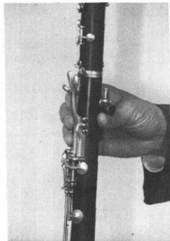
图二(2) 右手拇指持拿乐器的姿势