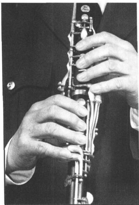
图二(3) 两手正面持乐器的姿势