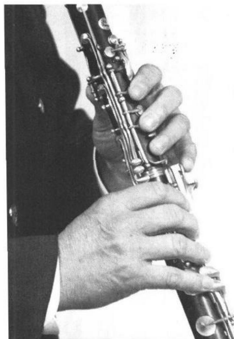
图二(4) 侧面持乐器的姿势