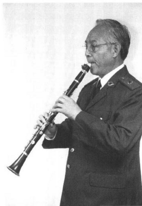
图三(2) 侧面演奏姿势