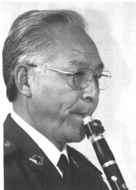
图四 右侧口型与含笛头的位置