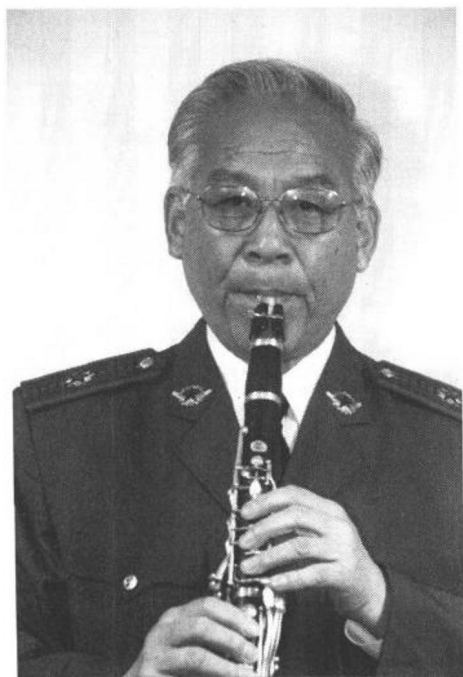
图三(1) 正面演奏姿势

在练习演奏时一定要注意头正身直,肩、肘、腕和手指要协调自如,使乐器形成身体的一个组成部分。演奏时,左右两手支撑乐器管身,口型含笛头使三者将乐器的重量均衡。其乐器与身体之间相隔以 40 度角为宜(图三)。