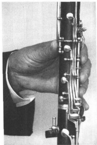
图二(1) 左手拇指按音孔的姿势

初学者开始学习单簧管演奏首先接触的是如何持拿乐器(这一点很重要,一定要认真掌握),其正确的方法是以右手拇指第一关节前与指甲相连的位置,抵住乐器指托将乐器支撑住,其余四指分别置于音孔与音键上,其手型呈自然状态。(图二)