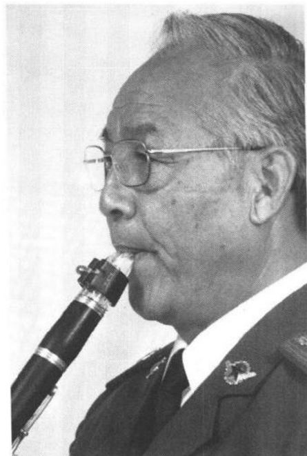
图五 左侧口型与含笛头的位置

胸腹式呼吸法包括正确的吸气与正确的呼气两个方面。正确的吸气即:用两边的嘴角吸气,胸腹同时扩张,深吸下沉,把吸入的空气控制在腹肌部位,以此作为气息的支撑点。正确的呼气即:在呼气时以腹肌部位作为支点,使呼出的气流平稳均匀地通过胸腔、喉咙、口腔形成一条气线,在口型的控制下将气送入笛头,使簧片震动发出本乐器的声音。整个呼气的过程都是自然的,特别需要注意的是喉咙不要憋住,这样容易造成气流受阻,影响正确的发音。