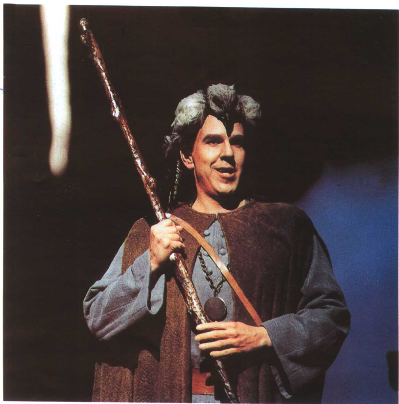
罗克威尔·布莱克演出的《苏格兰国王》第一场剧照