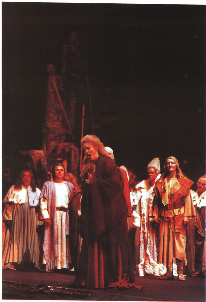
《艾莲娜》第二场中的剧照