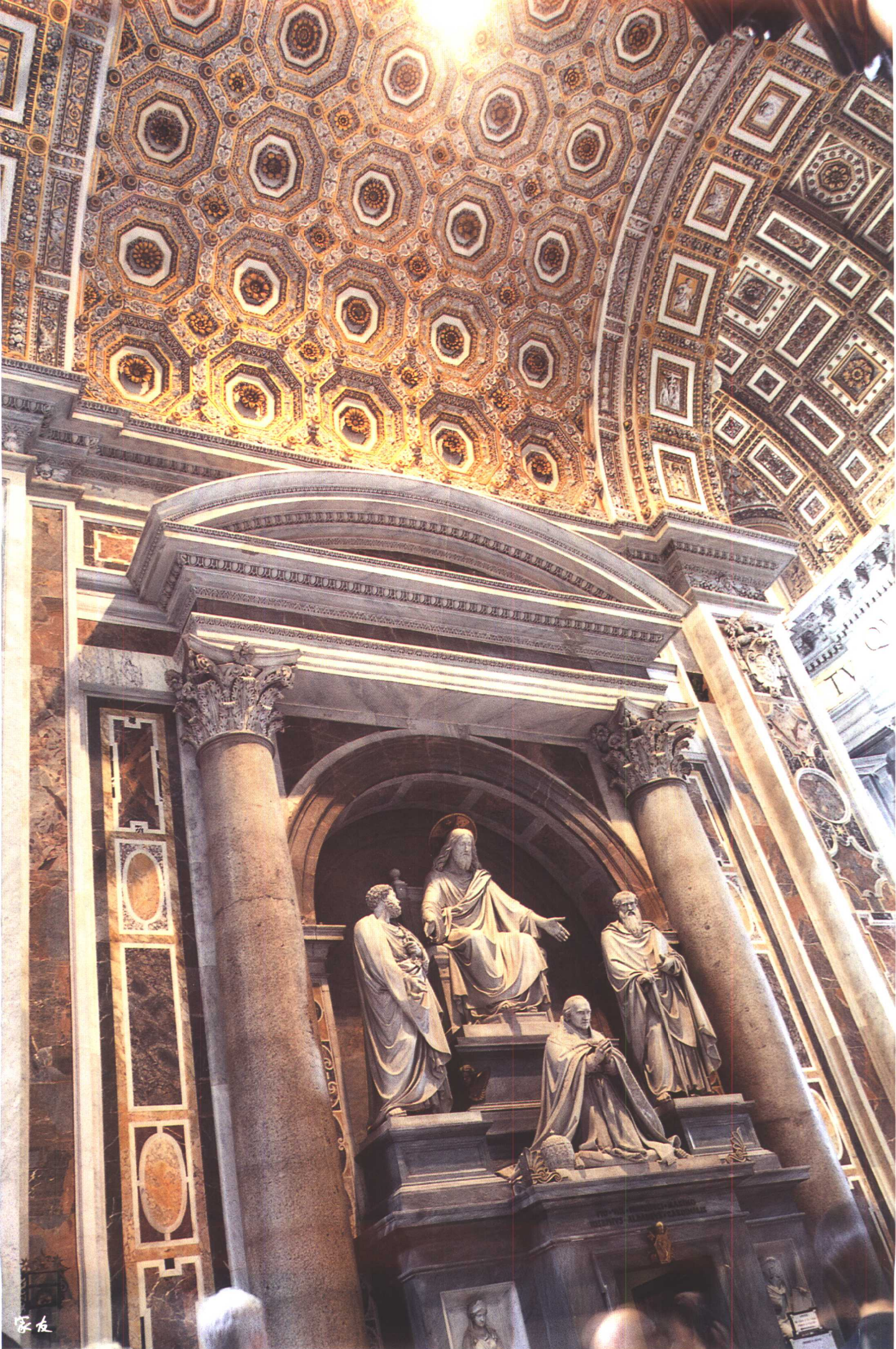
梵蒂冈(Vaticano) 圣彼得教堂内景