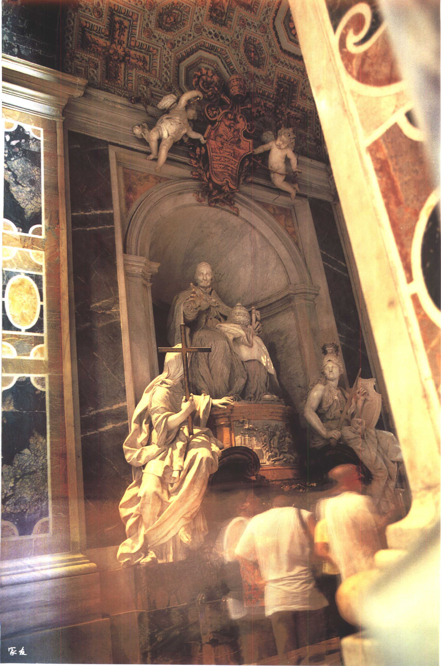
梵蒂冈 (Vaticano) 圣彼得教堂内景