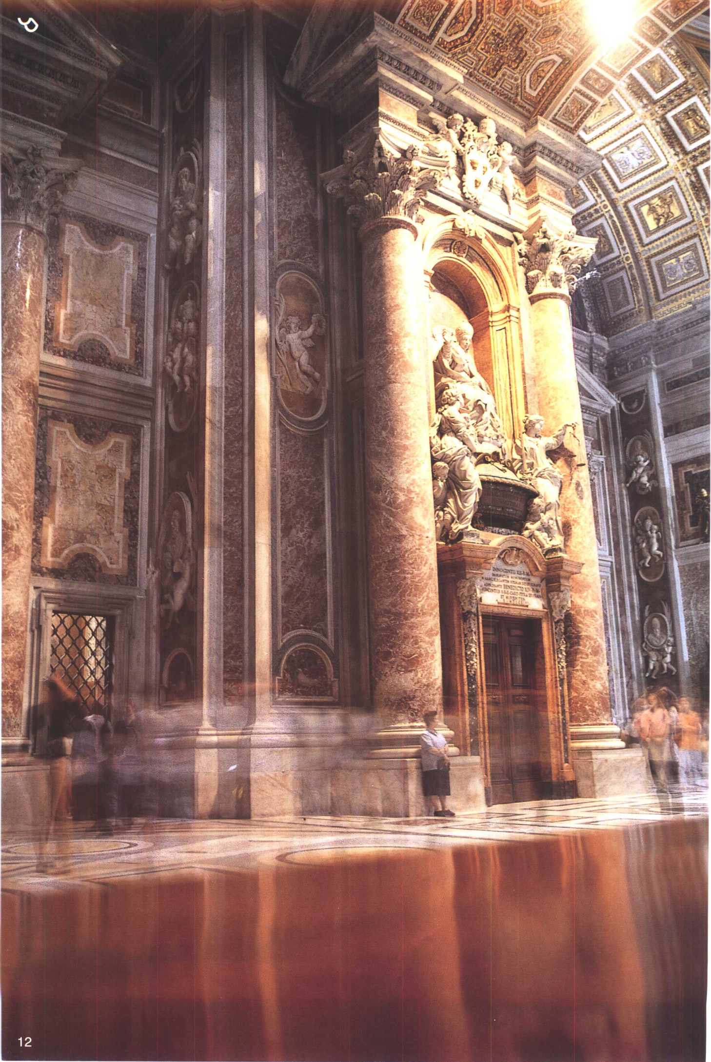
梵蒂冈(Vaticano) 圣彼得教堂内景