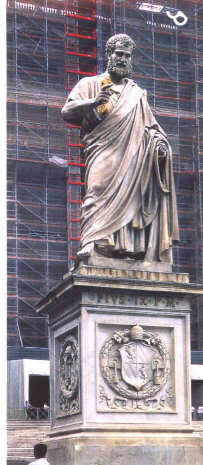
梵帝冈(Vaticano) 圣彼得教堂场景(局部)