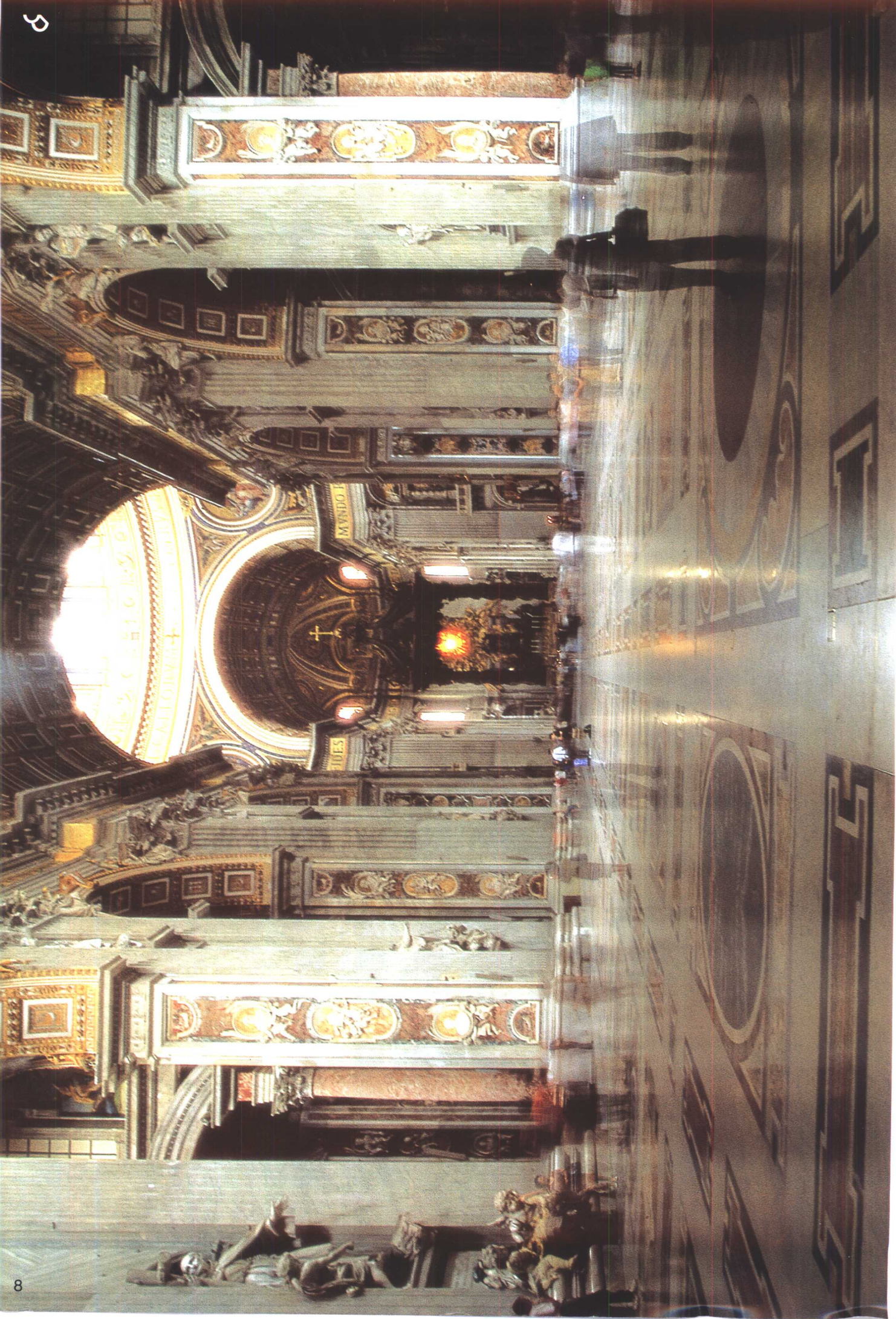
梵蒂冈(Vaticano) 圣彼得教堂内正视大场景。正中著名的青铜华盖是由贝尔尼尼雕刻的，有五层楼房那么高。