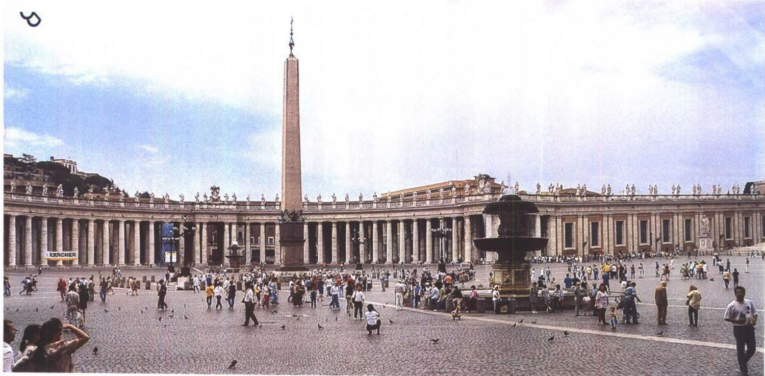
梵蒂冈(Vaticano) 圣彼得广场