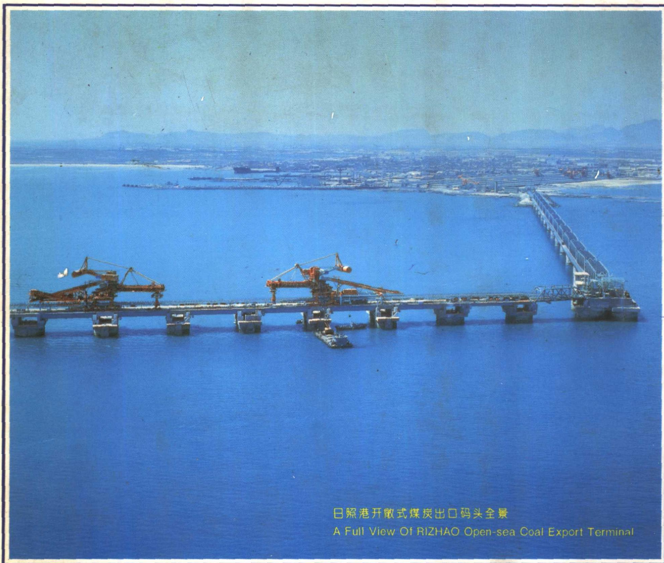
日照港开敞式煤炭出口码头全景