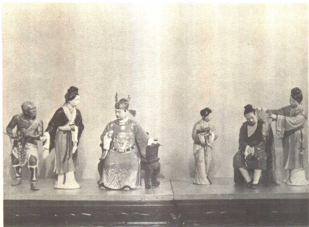
情 探 (泥塑)