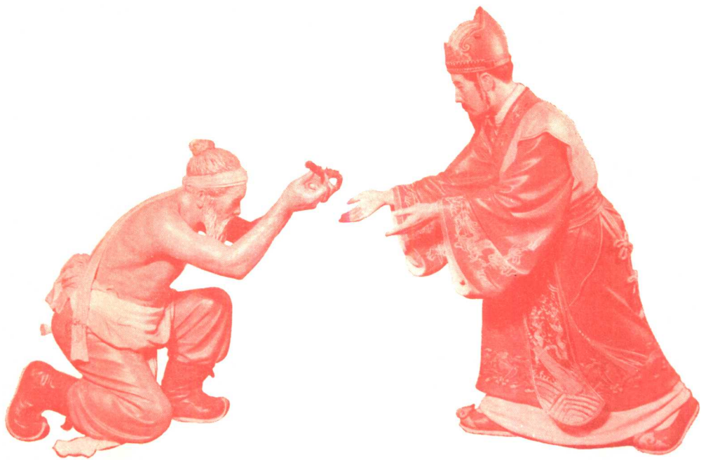
將 相 和 (泥塑)