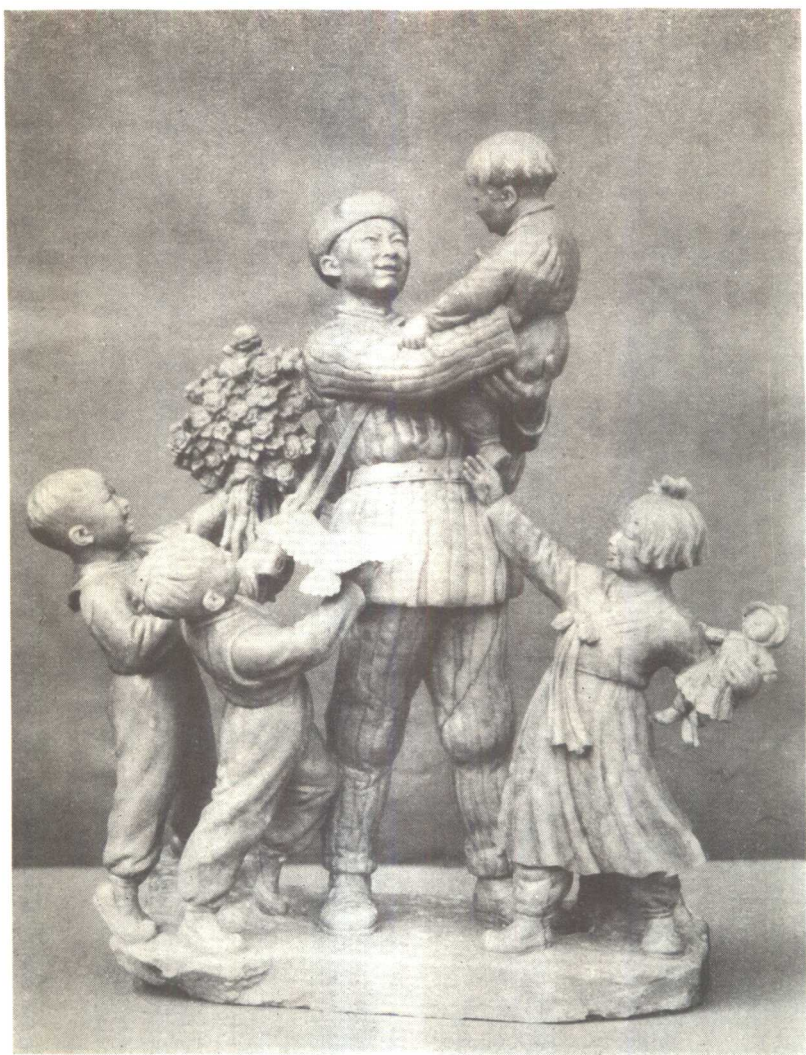
志願軍熱愛朝鮮兒童