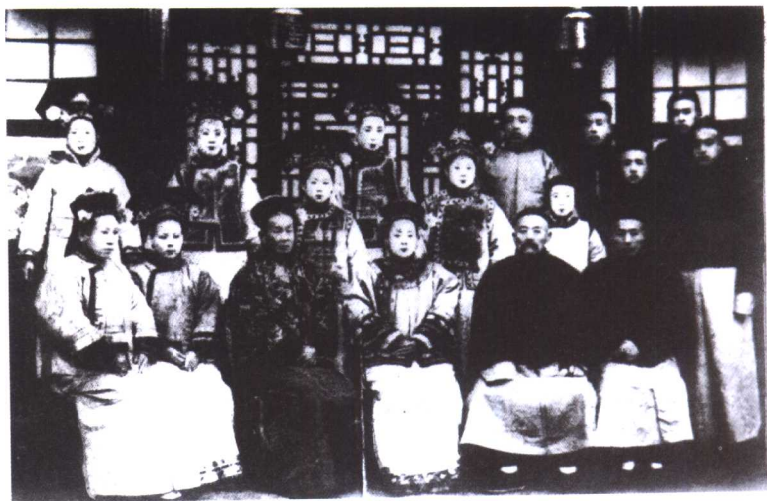
叶赫那拉家族。前排右起第二人为作者的祖父，中排右起第一人为作者的父亲。