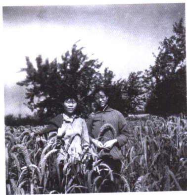
1971年，在农场田野里（右为作者）。