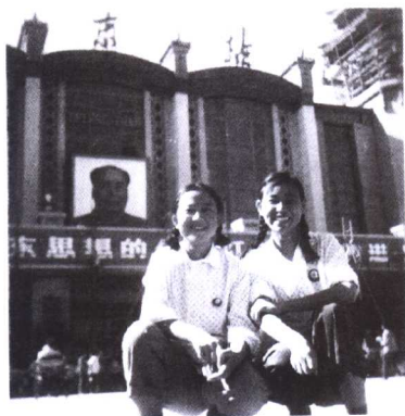
1966年，与妹妹在北京站留影（右为作者）。