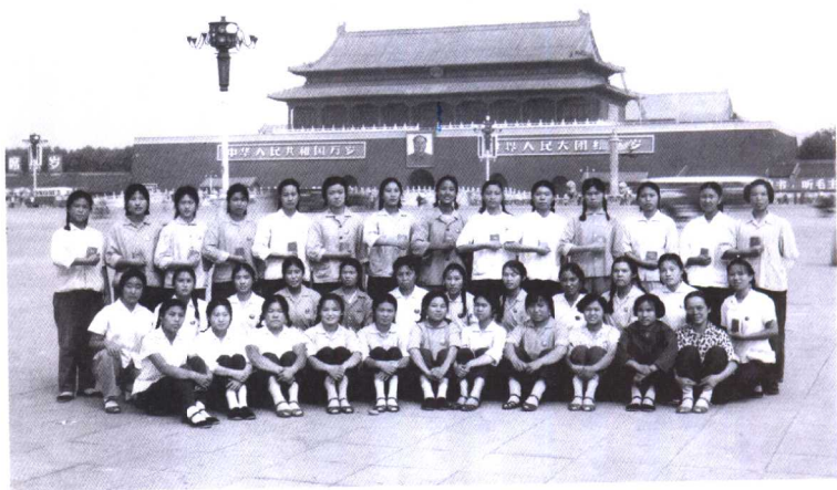
1968年，离开北京前夕，与同学们在天安门前留影（后排右起第六人为作者）。