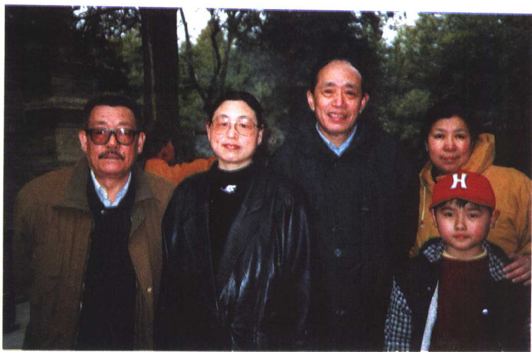
1996年，与电视剧《家族》剧组演员们的合影（左二为作者）。