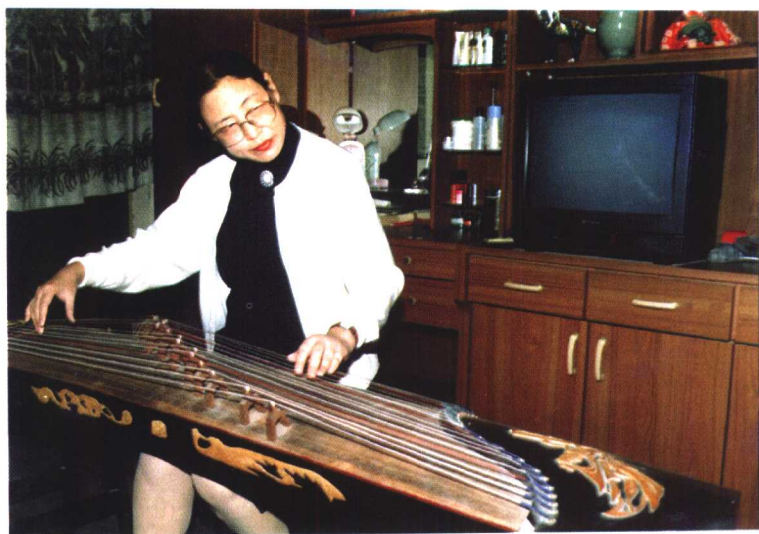
喜欢音乐,闲时也拨弄两下古筝。