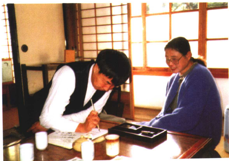
1992年，与丈夫在日本，新春试笔。