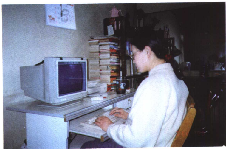
1998年,在写《没有日记的罗敷河》。