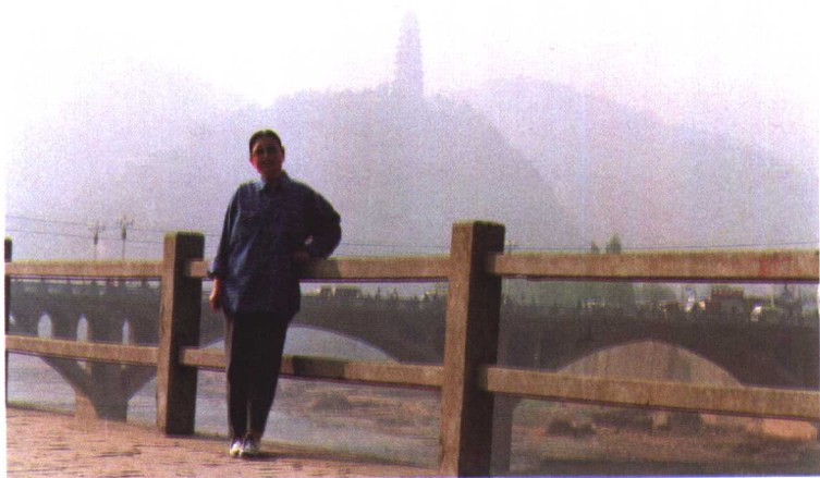
1997年，再去延安。旧地重游，在原地留影。