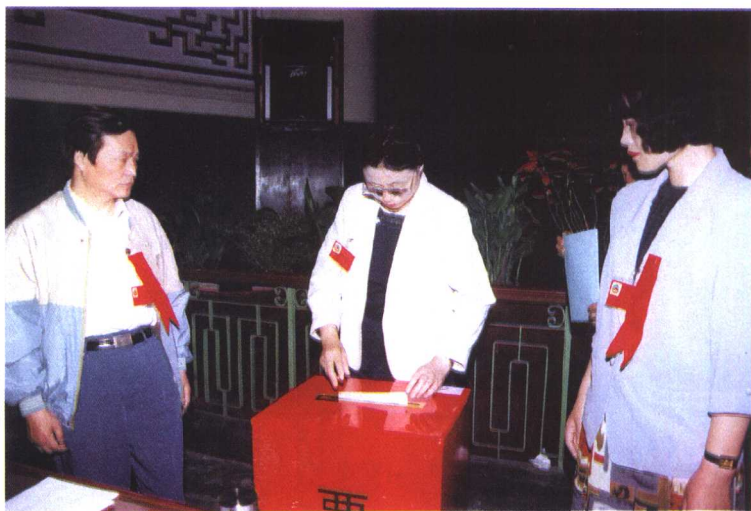
1997年，在西安市政协会议上投票。