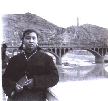
1967年，步行串联，在延安留影。