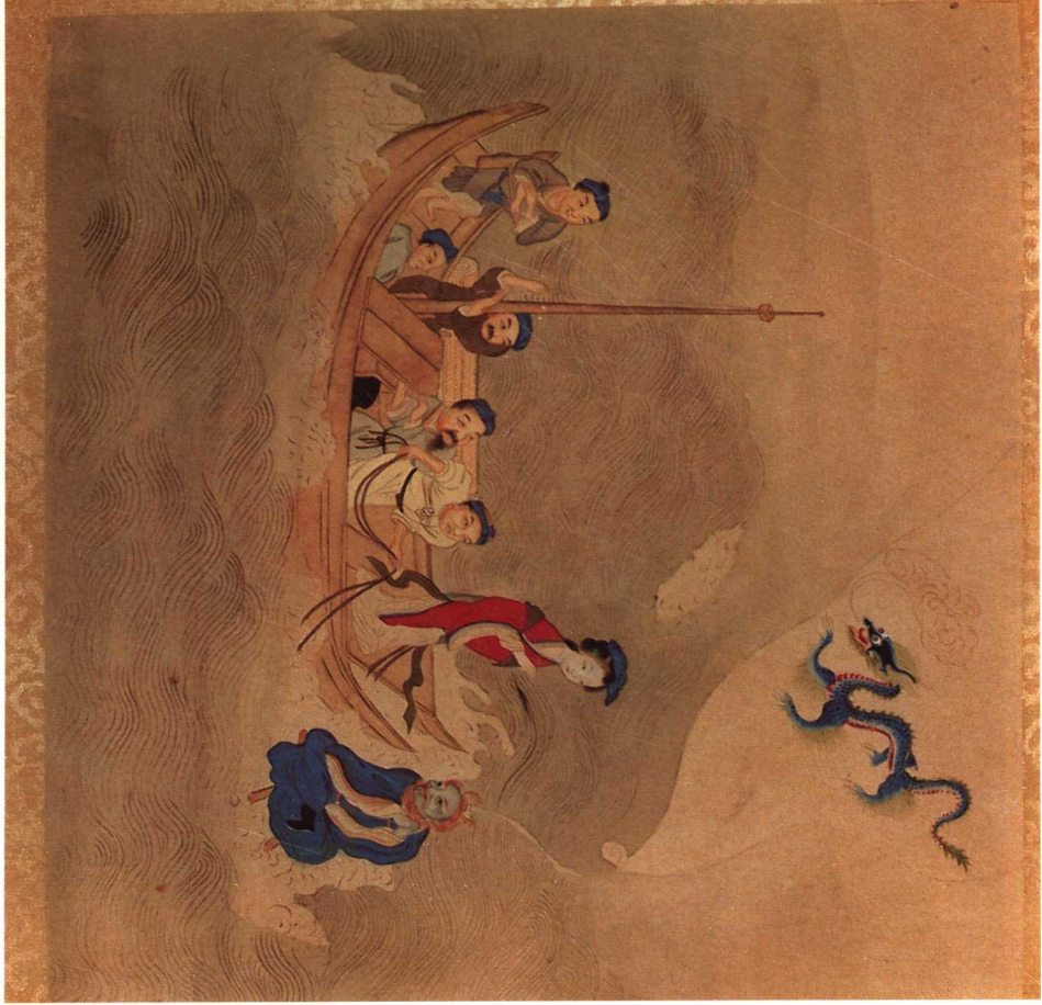
圖六 天后聖母事跡圖誌·投法繩晏公歸部

投法繩晏公歸部 有晏公者浮海為怪 后先施法力制之雖伏神威 未能誠服後乃假遙色相幻一神龍興壽鼓浪來犯 后舟后命投下緋繩隨攝隨粘牢固難解始懼而 伏罪 后囑曰東溟險阻爾當護民收為部下總管