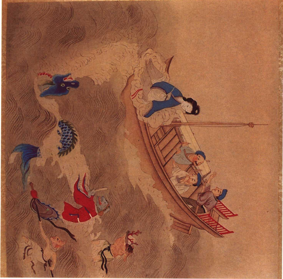
圖七 天后聖母事跡圖誌·率水族龍子來朝 中國歷史博物館藏

東海多神怪 后乃命棹中流風日澄霽中見水族駢 集龍子鞠恭於前 后勅免朝即退至今 天后誕辰 猶然慶賀是日漁者不敢施罟下網