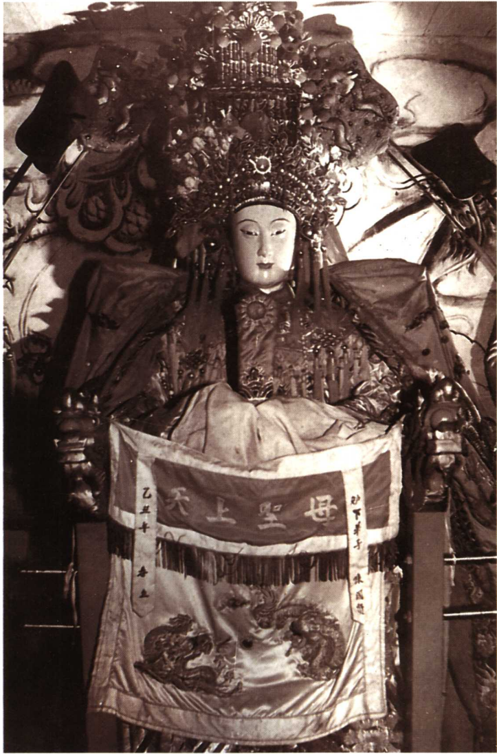
圖一 媽祖神像