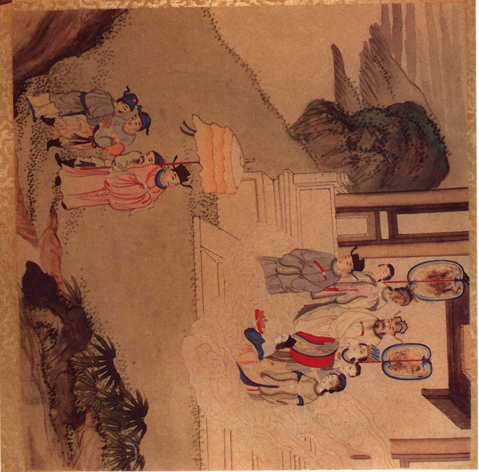
圖二 天后聖母事跡圖誌·建功勳合家封贈 中國歷史博物館藏

建功勳合家封贈 慶元六年大吳寇作亂閩帥討之賊勢甚銳眾恐懼禱神 頃刻間昏霧四塞返風旋捲其渠魁瑋蕩無遺奏凱具 陳神佑詔議進封先世于是封 后之父母及其兄與姊