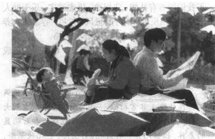
家庭——人生的“第一所学校”

人之初，有的婴儿表现得平静、安详，有的却好动、好闹。为什么会有这种性格上的差异呢？