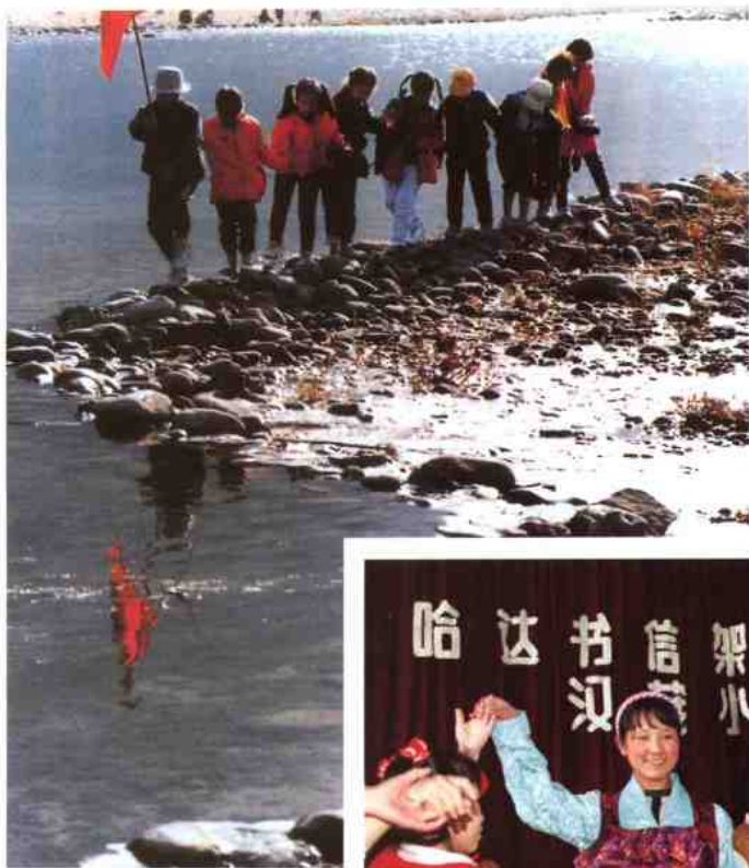
◁ 积极参加集体活动 锻炼良好性格