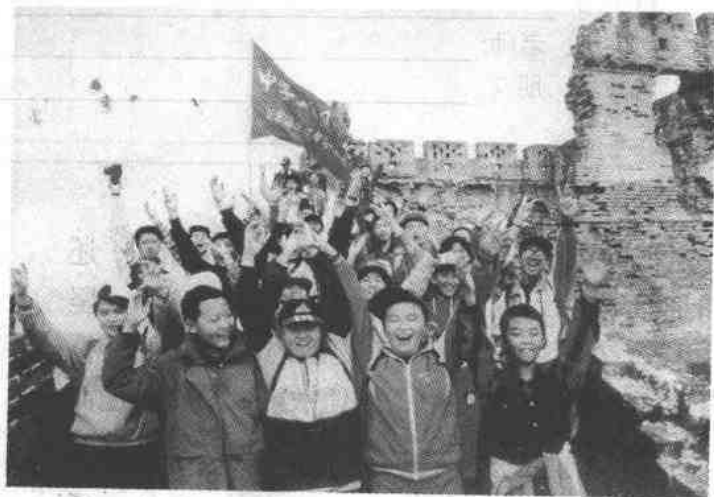
活泼开朗 朝气蓬勃

朝气蓬勃地对待生活，这是良好性格的表现。相反，情绪很不稳定，时常大起大落，难以控制，甚至遇到琐碎小事也会引起强烈的情绪波动，或者经常忧心忡忡，郁郁寡欢，都是在情绪方面性格缺陷的表现。