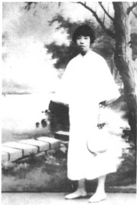
1926/1927年执教于广东省第一女子师范学校时