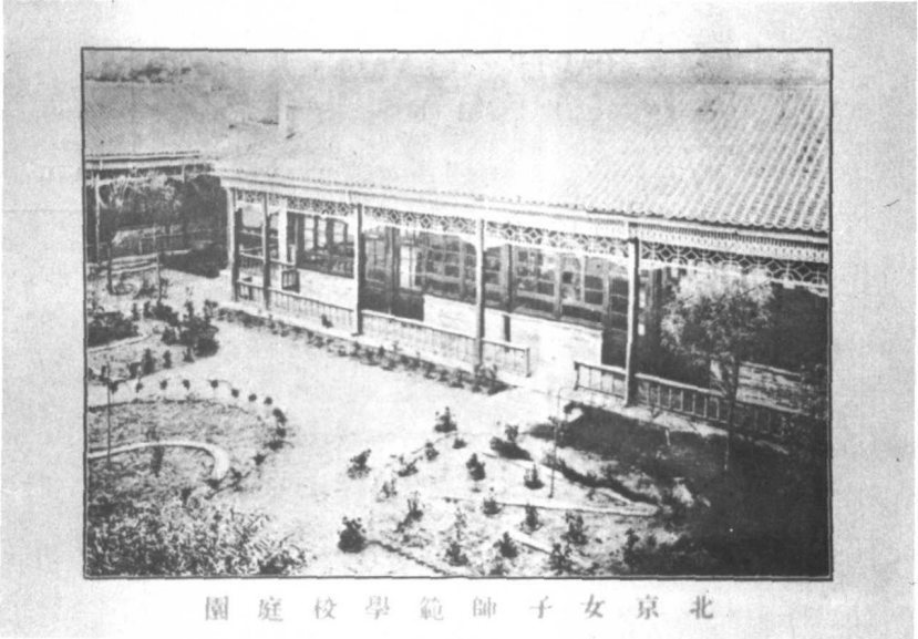
北京女子师范大学校园