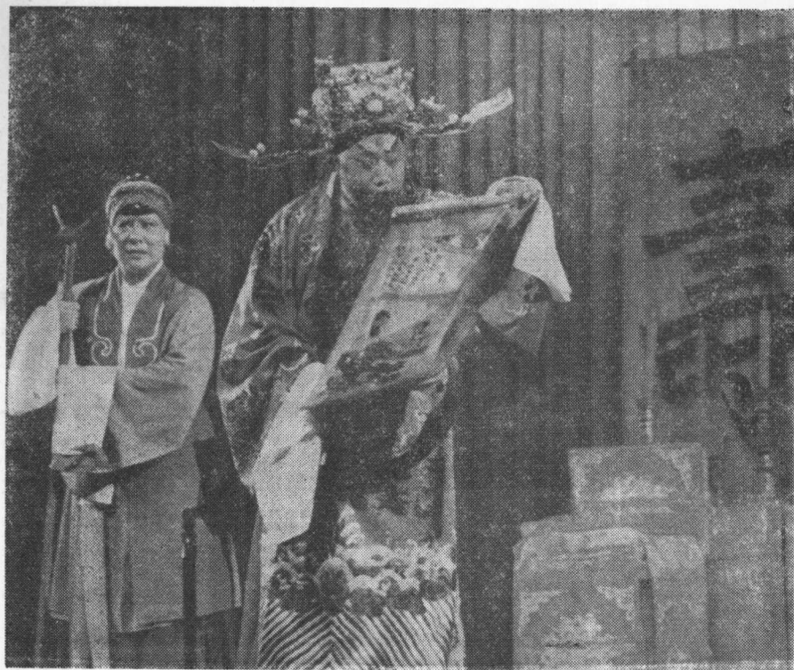
寇准——周云敏饰 刘婆——孙花满饰