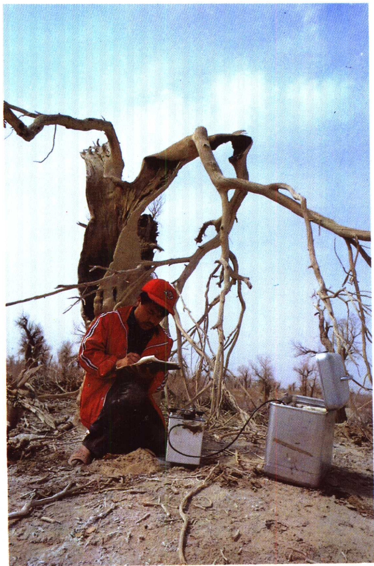
▲在原始胡杨林里作重力勘测