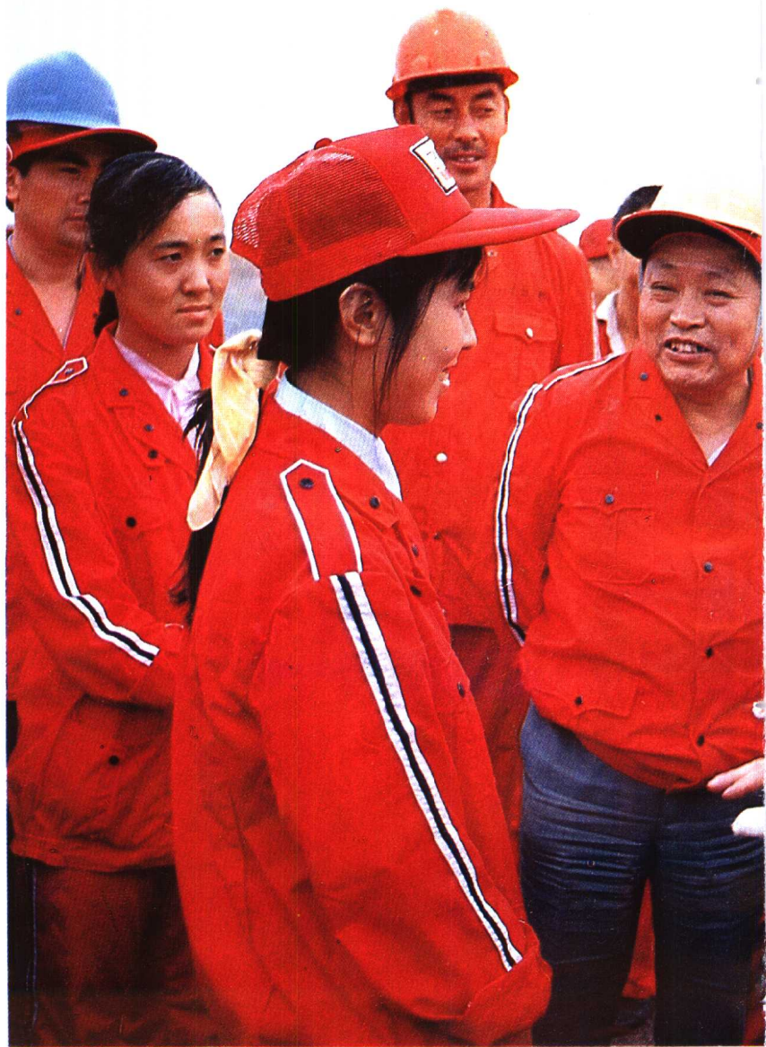
▲江泽民总书记对女大学生方珂说：“千里之行，始于足下。”