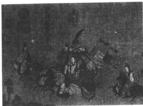
東晉 顧愷之 洛神賦圖卷（部分）

此外，一談到中國畫的演變，就要提到北宋時期的黃筌和徐熙兩大潮流，這兩大流派對於人物畫的演變都有極大的影響，前者屬素描派，後者屬沒骨派，各自確立人物畫的表現方式。