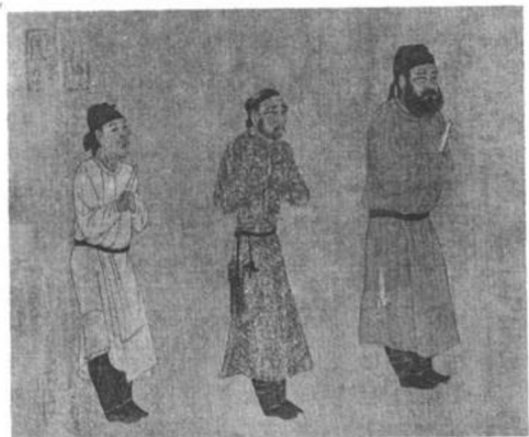
唐 閻立本 步輦圖卷（部分）