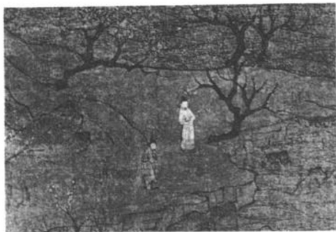
隋 展子虔 游春圖卷（部分）