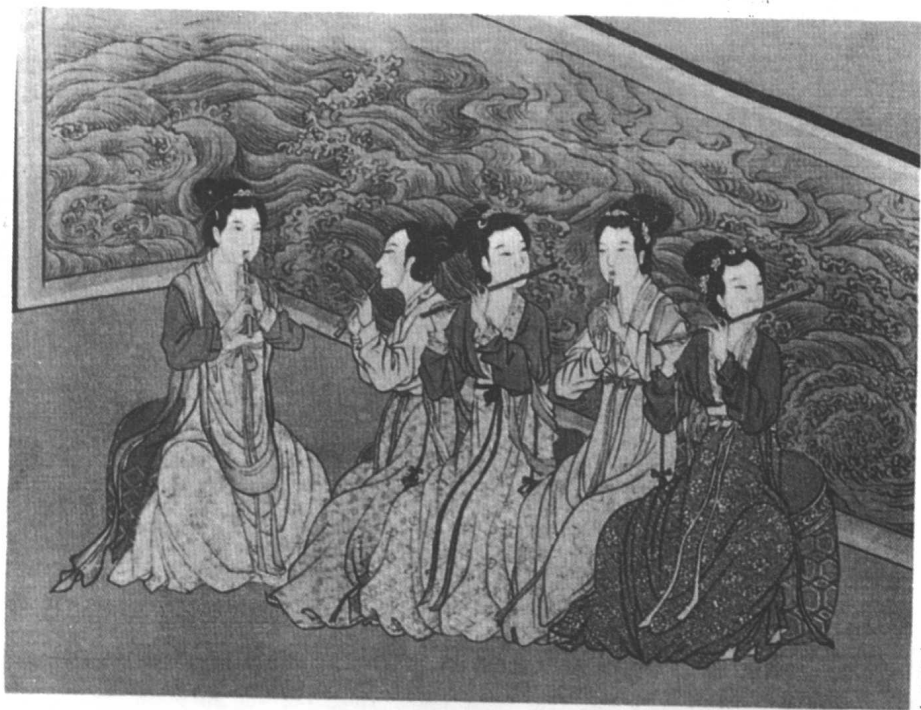
明 唐寅 臨·韓熙載夜宴圖(部分)