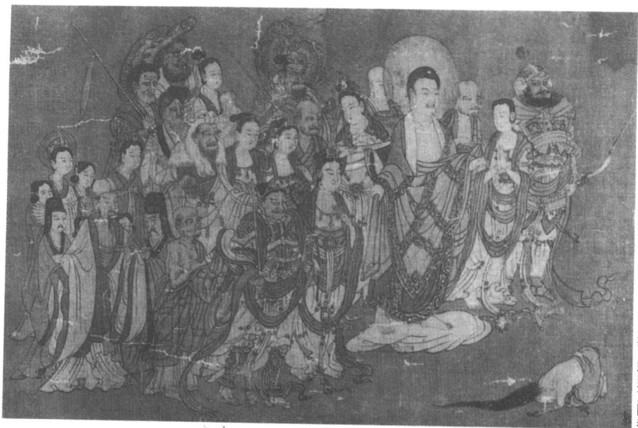
宋 元欵 燃灯授记释迦文图卷