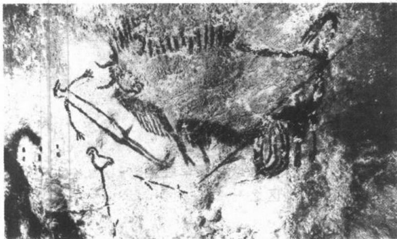
拉斯科岩洞里的壁画

的壁画和雕刻。这些壁画和雕刻堪称原始艺术的杰作。它们当中最负盛名的当推多尔多涅地区拉斯科洞穴的壁画。此处的壁画用红、黑两种颜色