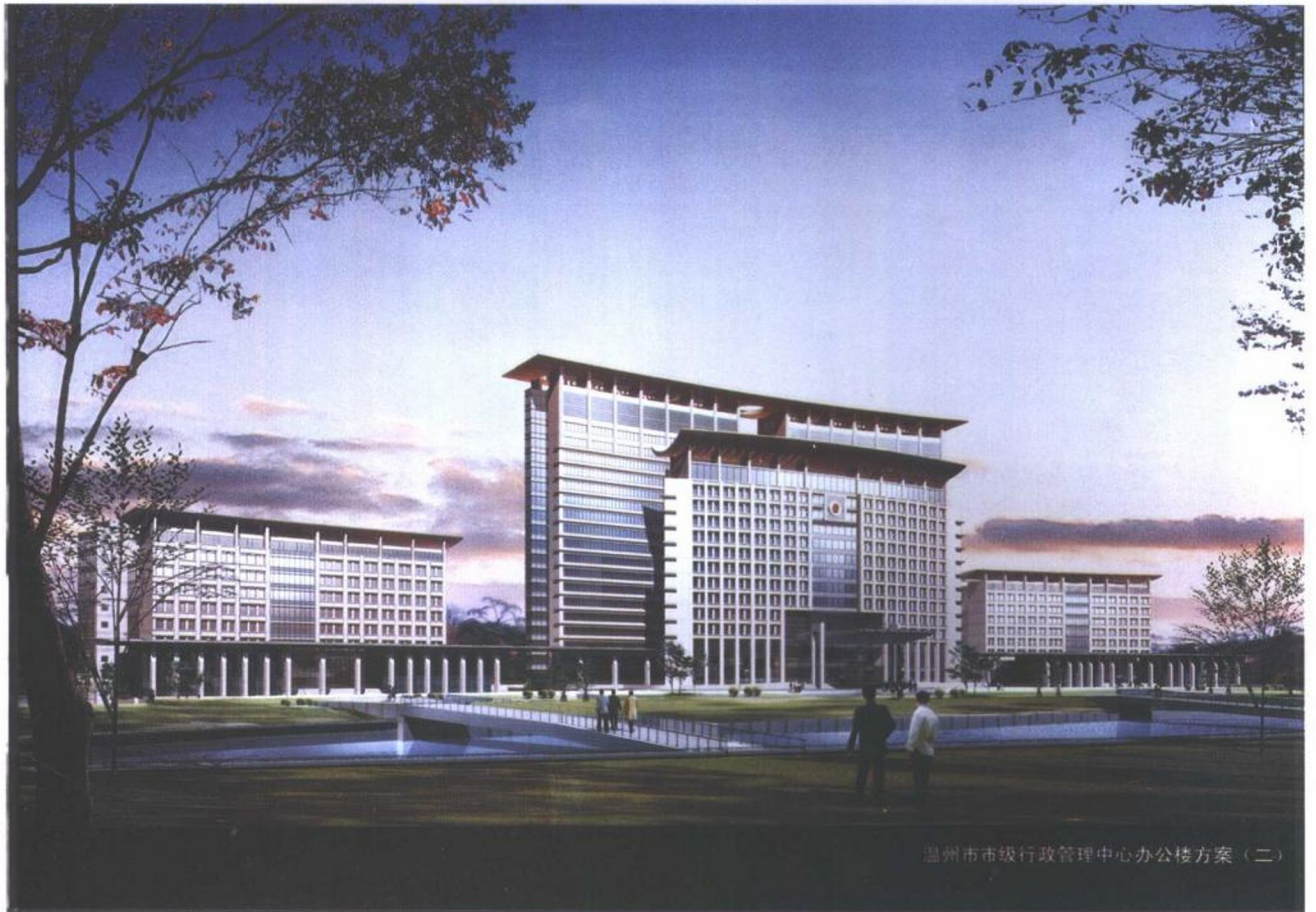
温州市市级行政管理中心办公楼方案(二)

随着新千年的钟声响彻瓯越大地，一幅现代化新中心的蓝图，在温州东部徐徐铺开。城市中心区这一片崭新的热土，将搭上温州这辆驶入快车道的列车，驶出让世人瞩目的速度。